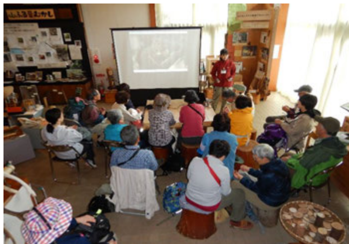
ビジターセンターでスライドによる案内