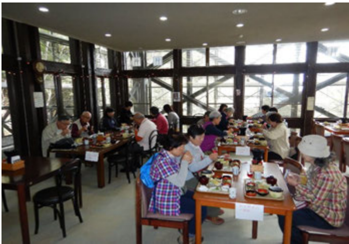
レストラン『とちの実』で昼食