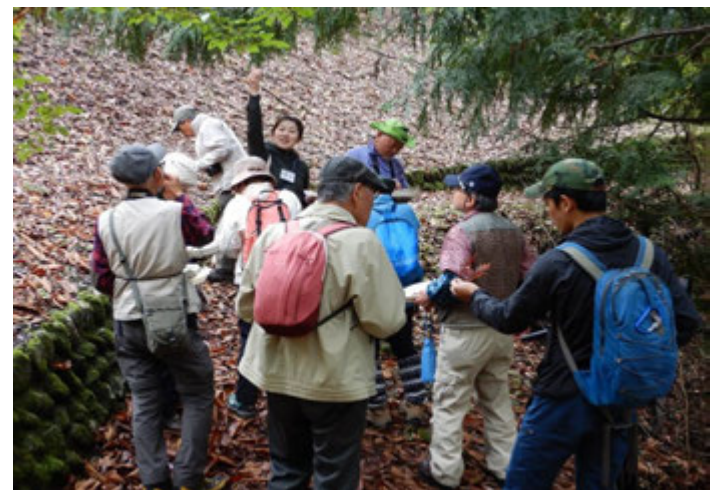
インタープリターによるガイドウォーク