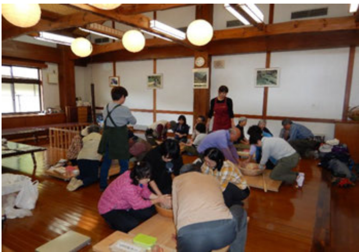
クラフトセンターでそば打ち体験