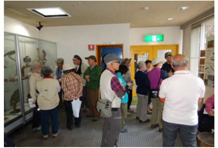
野鳥、動物の剥製等についての解説