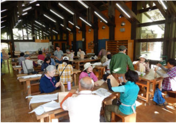
木材工芸センターでまな板を作成