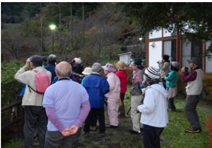
早朝にバードウォッチングを実施