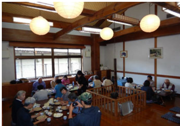
昼食に打ったおそばを試食