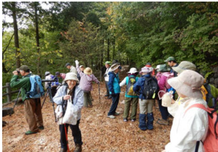
三頭大滝までの遊歩道で自然散策