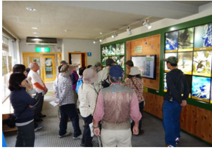
奥多摩の野鳥についての解説