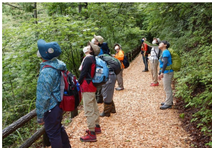
さえずるオオルリを探して