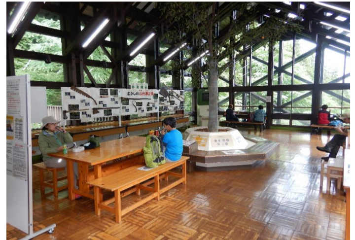
2階の休憩所で昼食