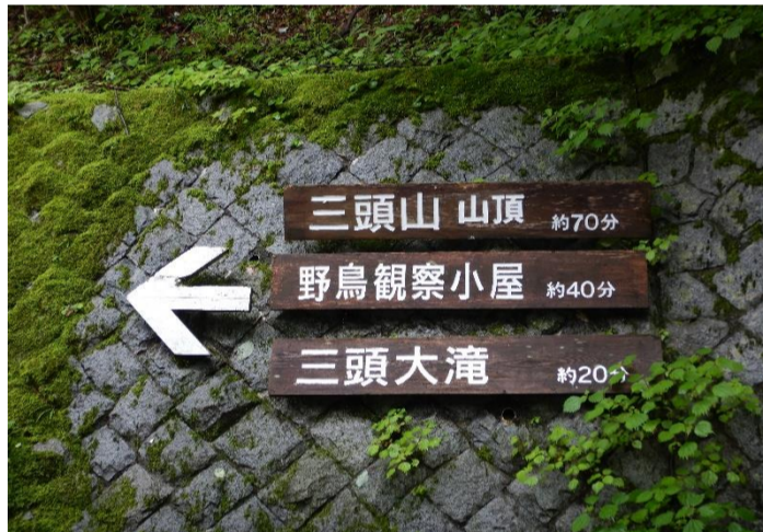
三頭大滝方面に向かいました