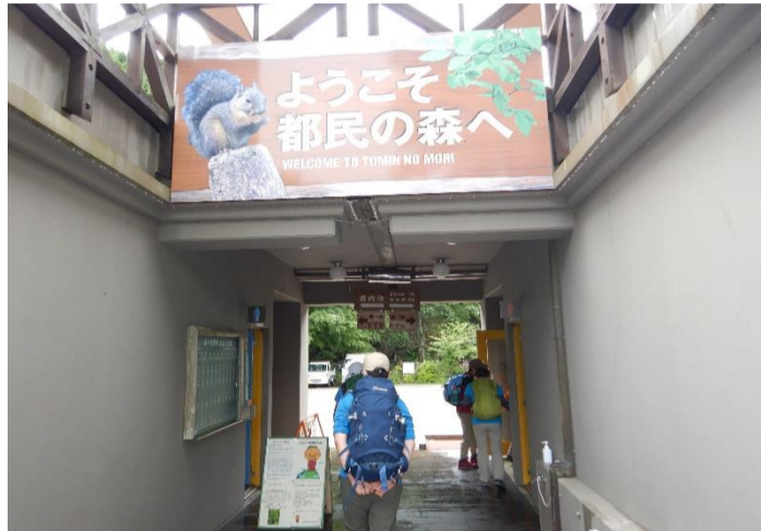
森林館まで上って