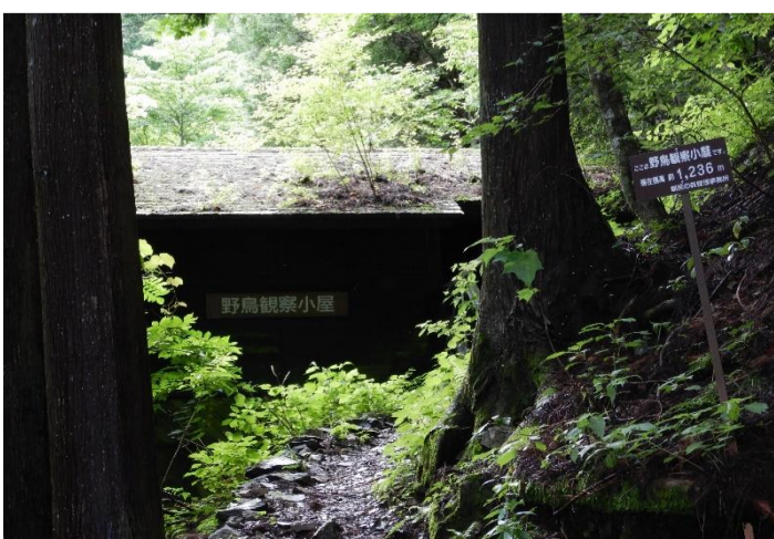
野鳥観察小屋まで登り