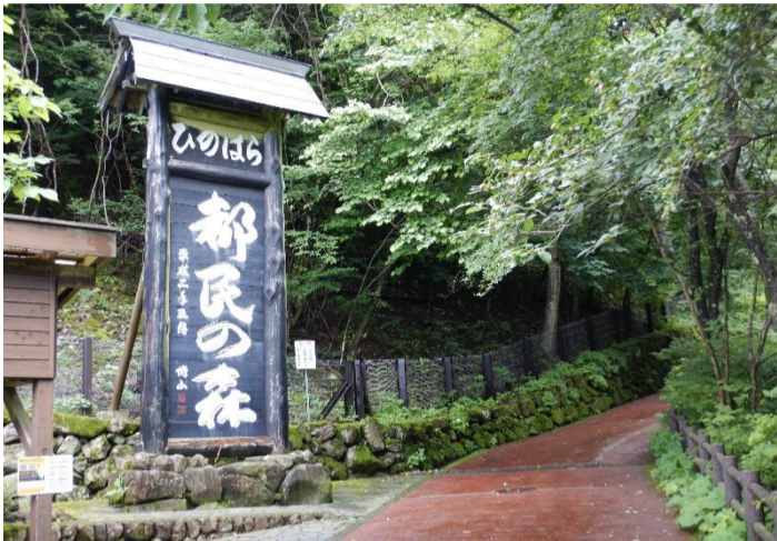
檜原都民の森駐車場から