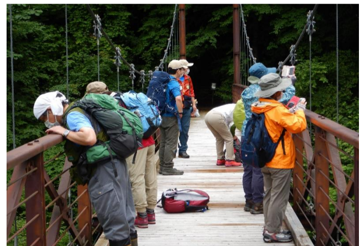
滝見橋から周囲を見渡して