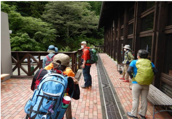
天候が良いうちに散策に出発