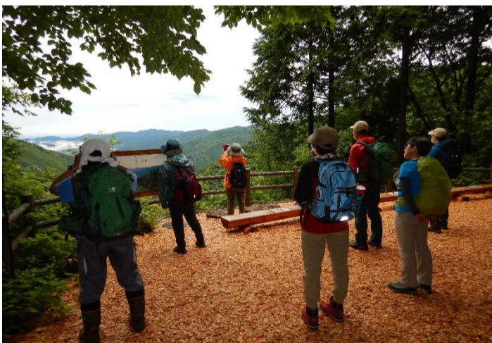
あきる野方面の山脈を眺め