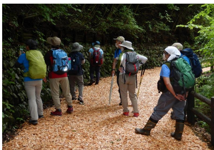
帰路は植物観察をして