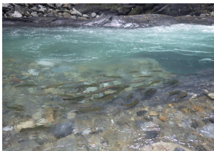
放流されたヤマメとマスを狙います