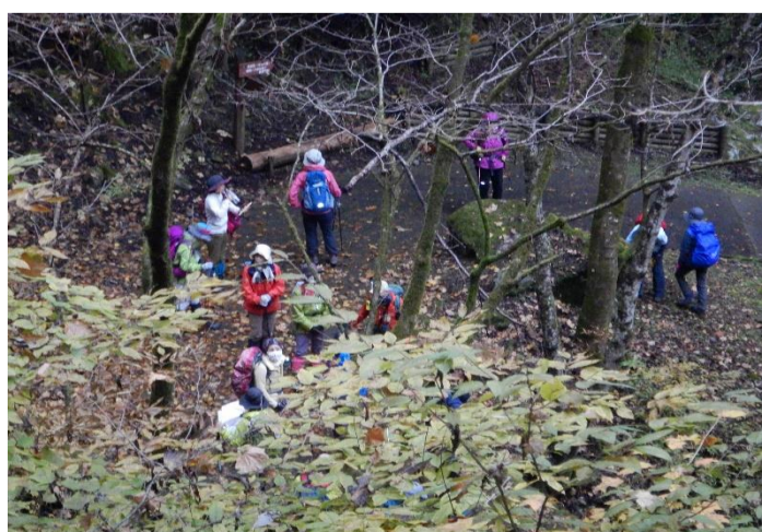
わさび田の広場に下り