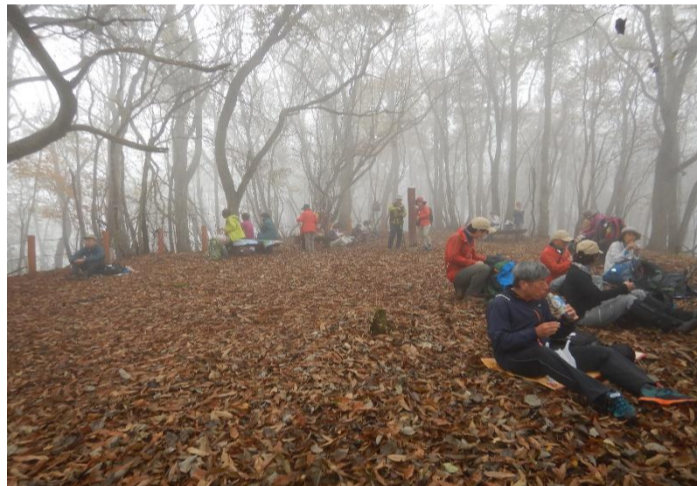
惣岳山山頂で昼食