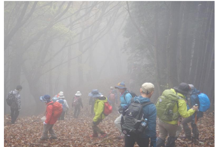
霧の中急坂を下り