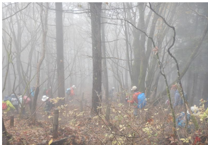
御前山山頂から下山開始