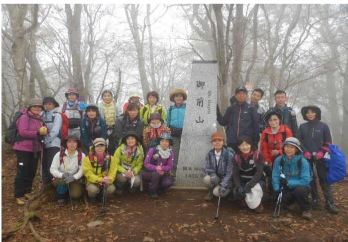
御前山山頂で記念撮影