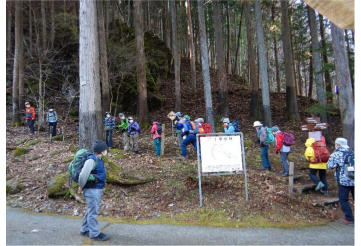
午後はトチノキ広場から入山して