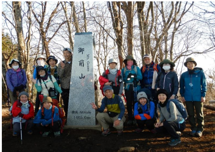
御前山山頂に着き記念撮影