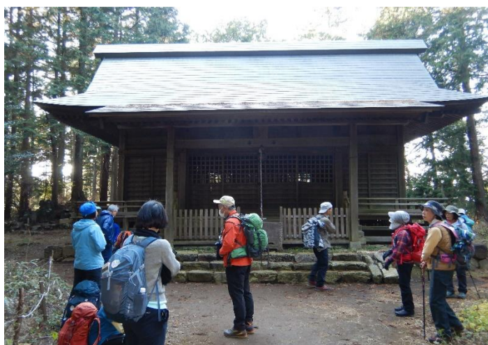
愛宕神社奥の院を見学