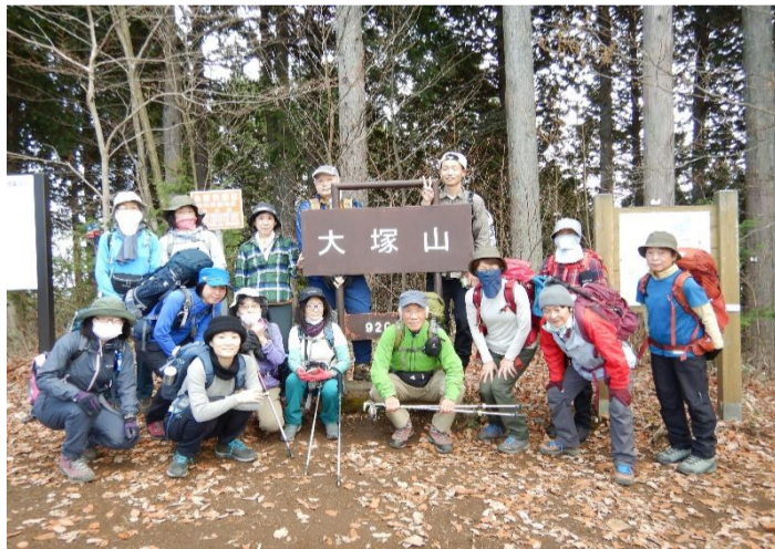
大塚山山頂に行きました