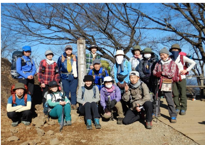
日の出山山頂で記念撮影