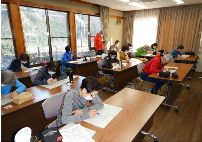
午前中は研修室でガイダンス