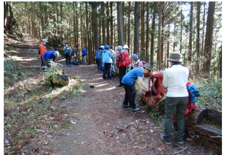
旧表参道の鳥居前で休憩