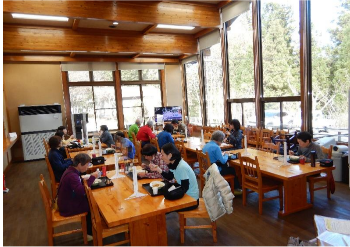
昼食はカレーライスを食堂で食べました