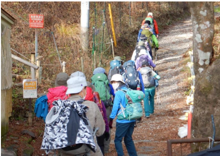
御岳平を出発して