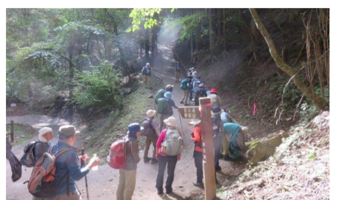
明日登る予定の山を眺めます