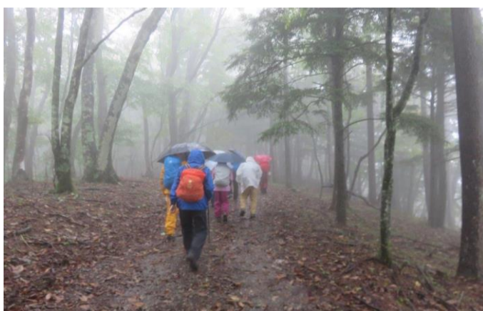
奈良倉山山頂で記念撮影