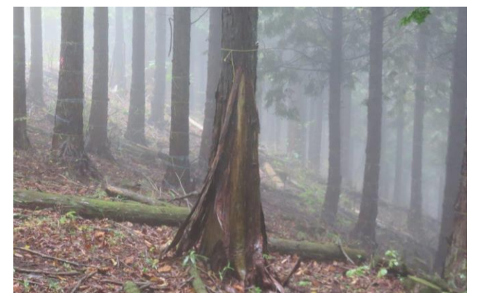
帰りは登山道で松姫峠へ戻りました