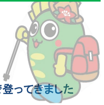
活動の広場まで登ってきました