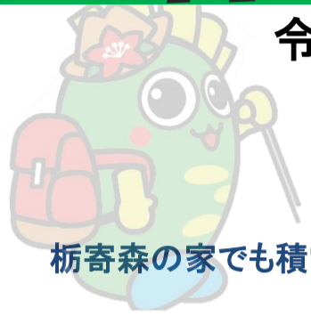
栃寄森の家でも積雪がありました