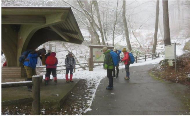
トチノキ広場で準備体操後出発です