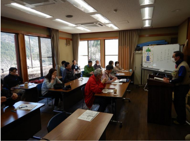
仕掛けについてのレクチャー