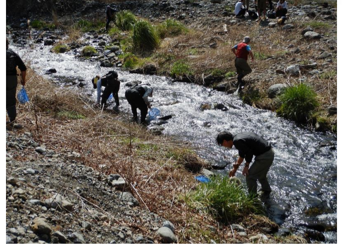
河原に到着後、明日使う川虫取り