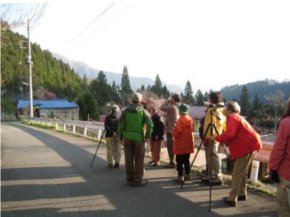
早朝バードウォッチング