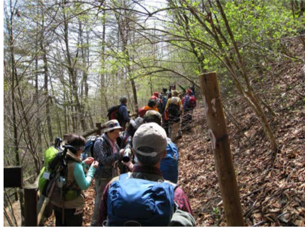
大滝の路を歩きました