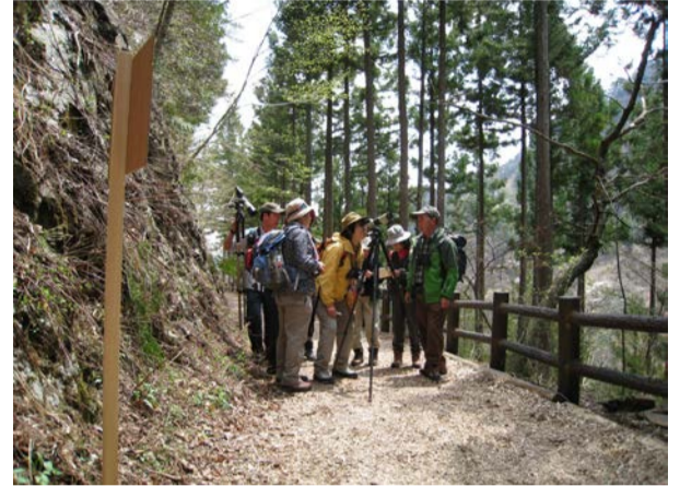
皆さん本当に熱心でした