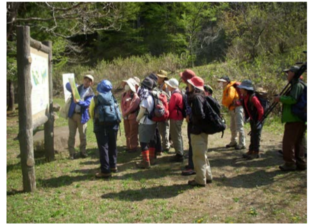
皆さん真剣に話を聞いてます