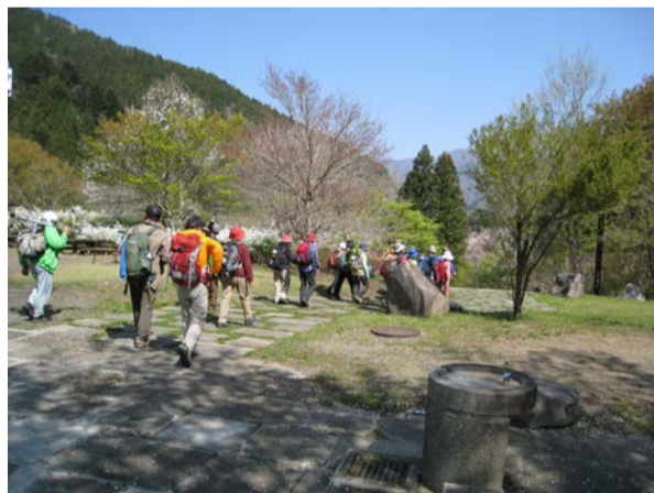
午前中は山のふるさと村にてガイドウォーク