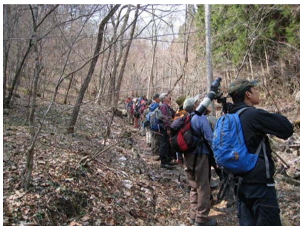
かおりの路でコガラ観察中