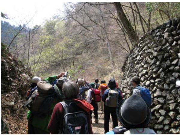
イタイカエデを見ている