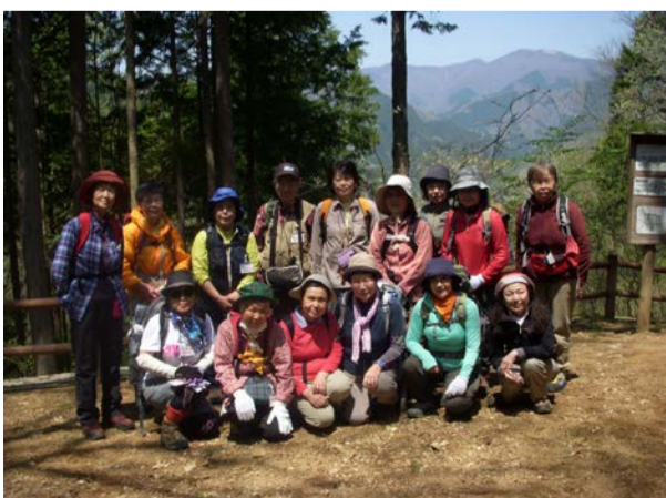
アカマツの広場で記念撮影