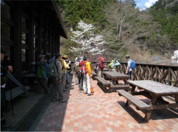
檜原都民の森森林館からスタート