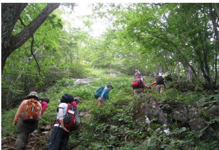
いくつかのピークを越えて