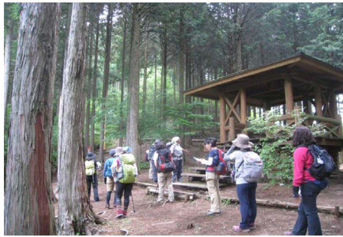
ヒノキの広場まで登りました