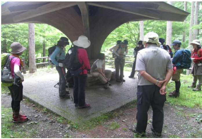
登山靴の履き方等を教えてもらいながら