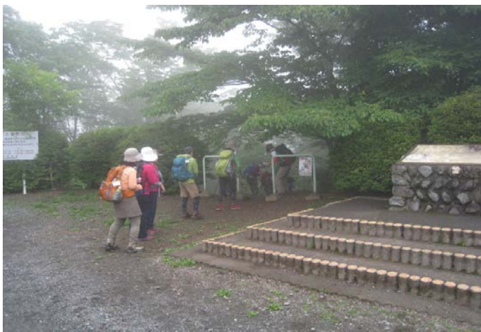
いくつかのピークを越えて