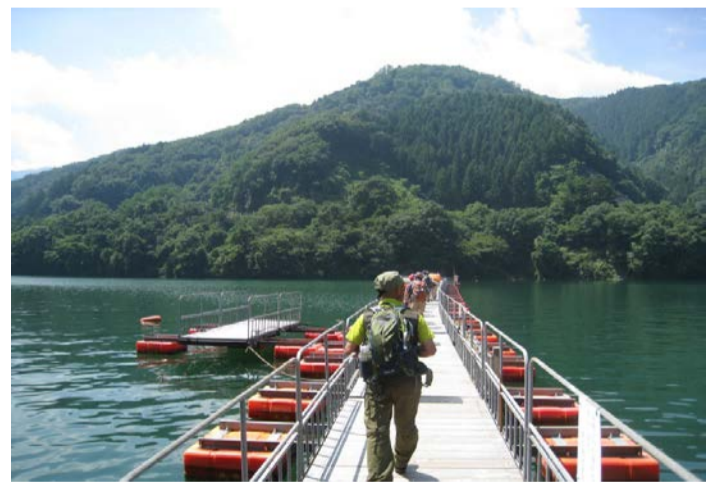
山のふるさと村まで歩きました