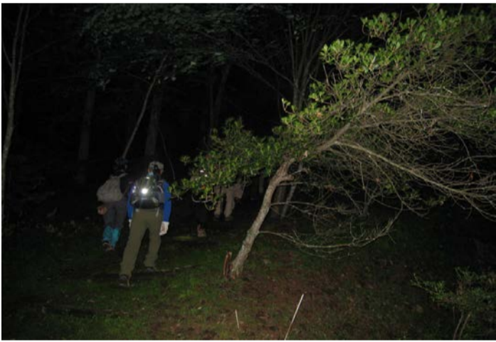
ヒメボタルを観ることはできました