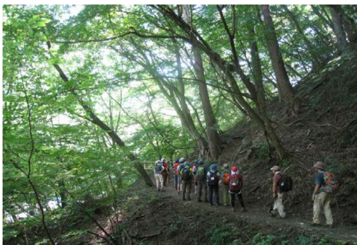
湖畔の小道を約1時間