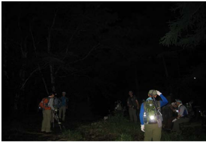
午後10時25分、御前山山頂へ