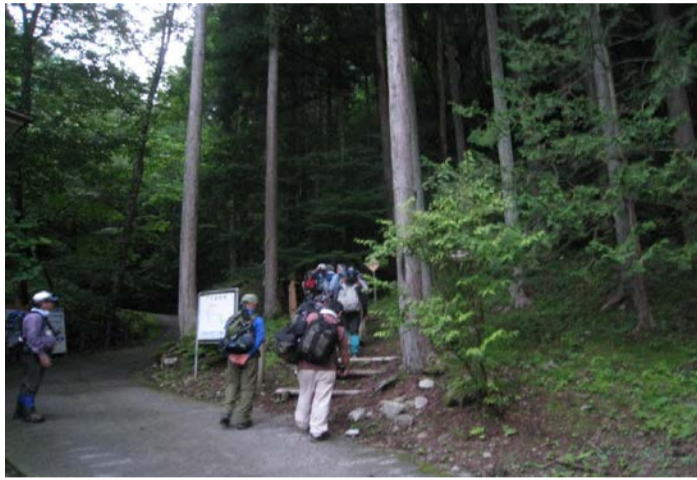
午後10時25分、御前山山頂へ