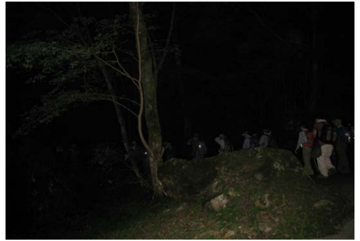
午前1時15分、トチノキ広場へ下山です