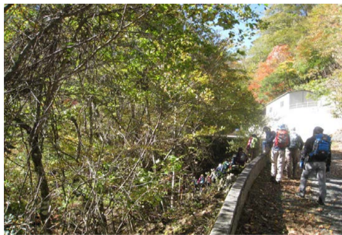
途中、風が強かったです