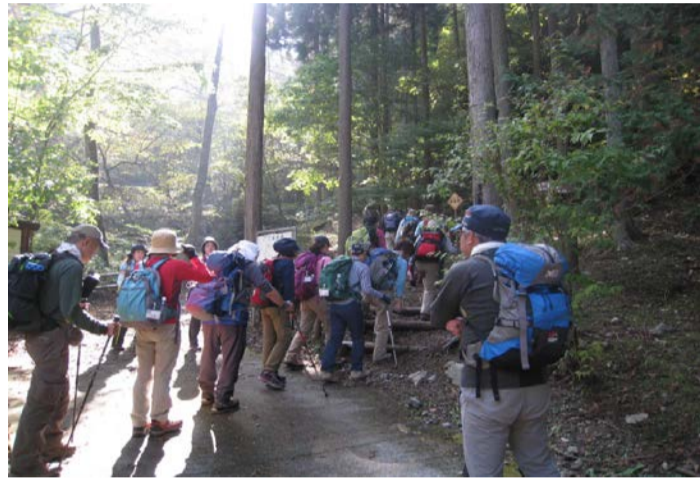
山頂まで歩きました