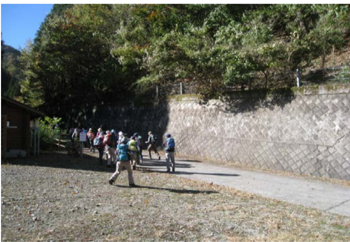
富士山も見る事ができました