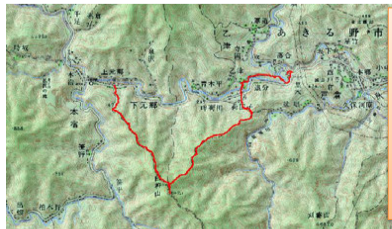
当日のルートです