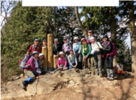
市道山に着きました。