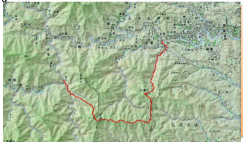
当日のルートです