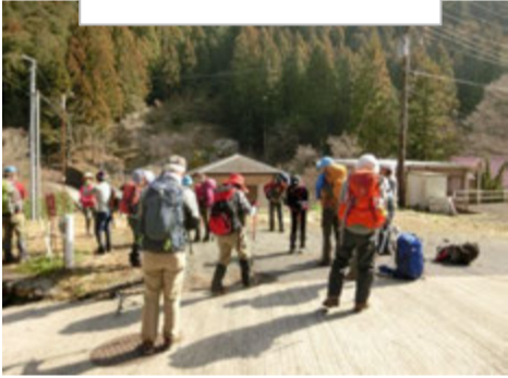
笹平から登りました。