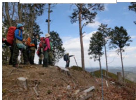
グミ尾根を下ります。