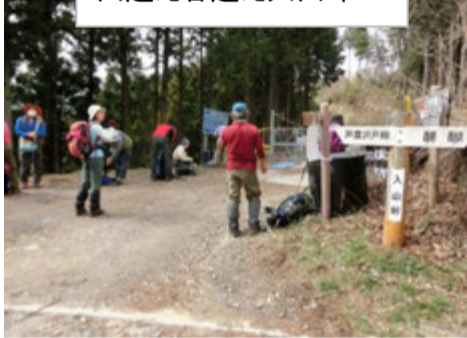
山越え谷越え入山峠