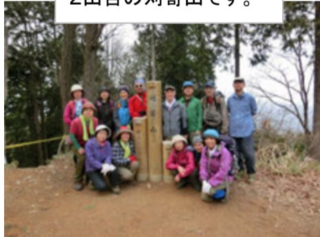
2山目の刈寄山です。