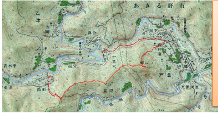
当日のルートです