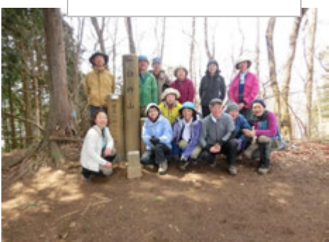
臼杵山で三山達成