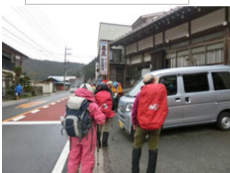
元郷から登ります。