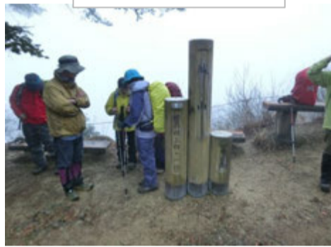
城山につきました。