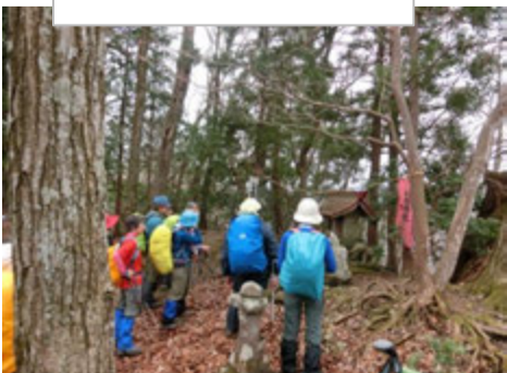
臼杵神社に着きました。