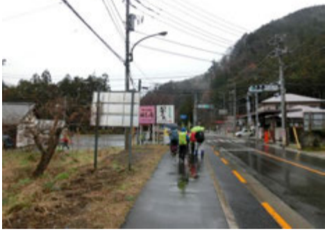
荷田子から登りました。