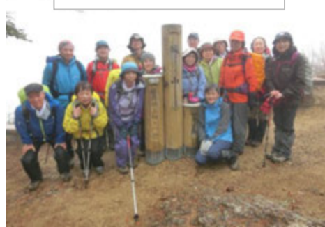
霧の中でハイポーズ！