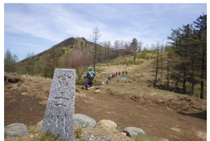
小さな分水嶺から