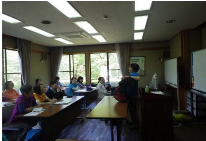
午後は室内講習と