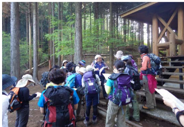
現在地を地図で確認しながら