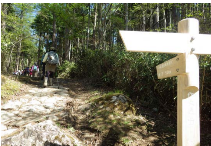
作場平からスタート