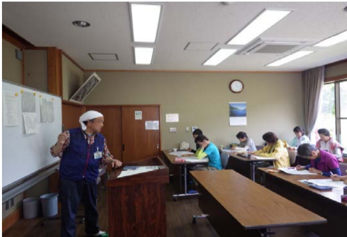
午前中はガイダンス