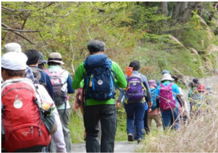
御岳溪谷遊歩道を沢井方面へ