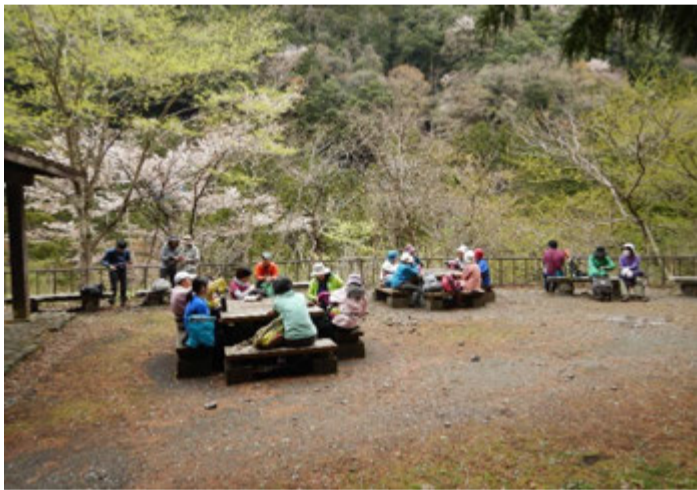
鳩ノ巣溪谷休憩所でティータイム