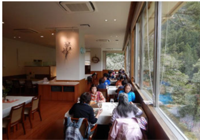
はとのす荘でのランチタイム