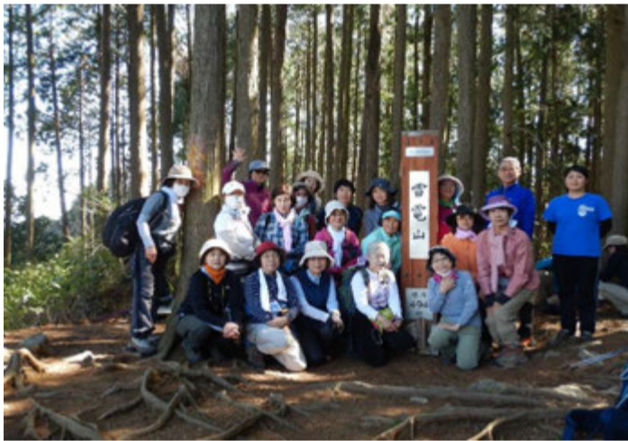
雷電山山頂で記念撮影