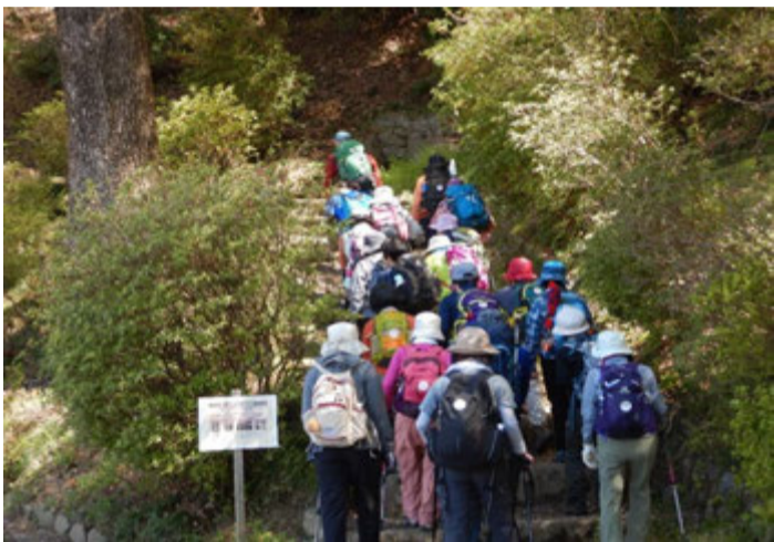
永山公園グラウンドからスタート