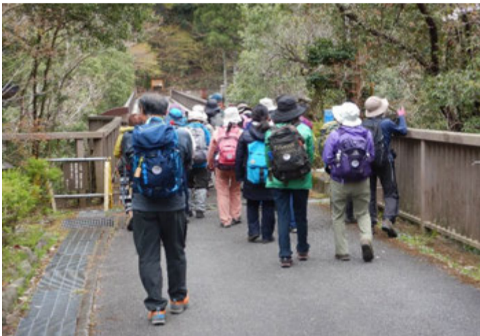
数馬狭橋からスタート