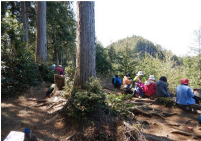
見晴らしの良い尾根の上でお弁当