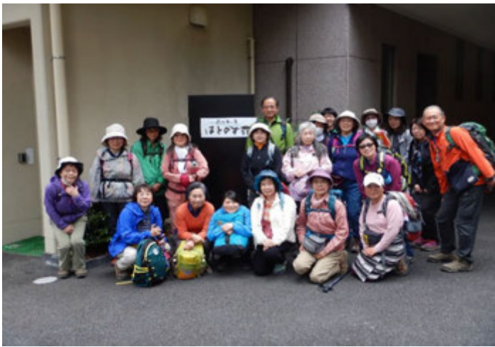
はとのす荘で記念撮影