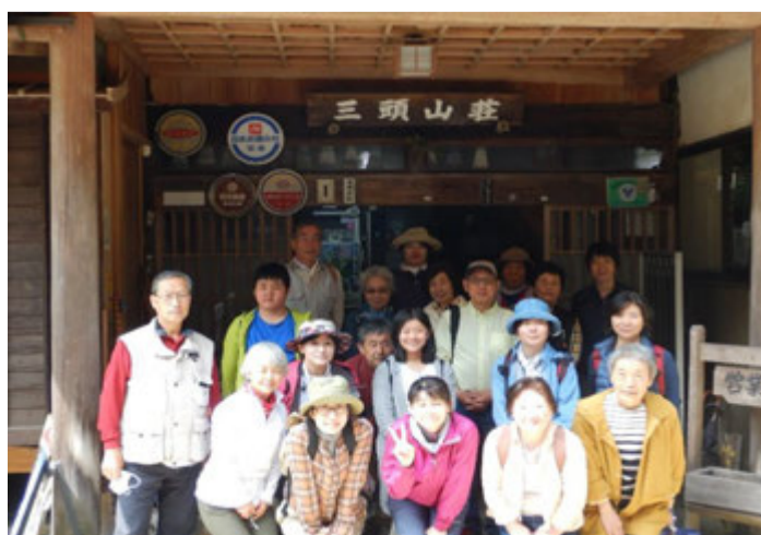
三頭山荘で記念撮影