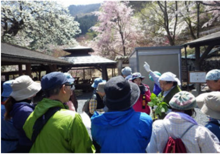
野草の説明を聞いて