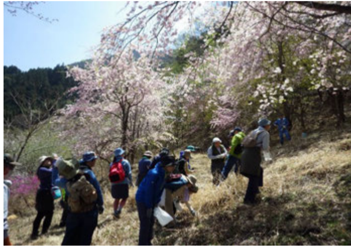
野草探しスタート