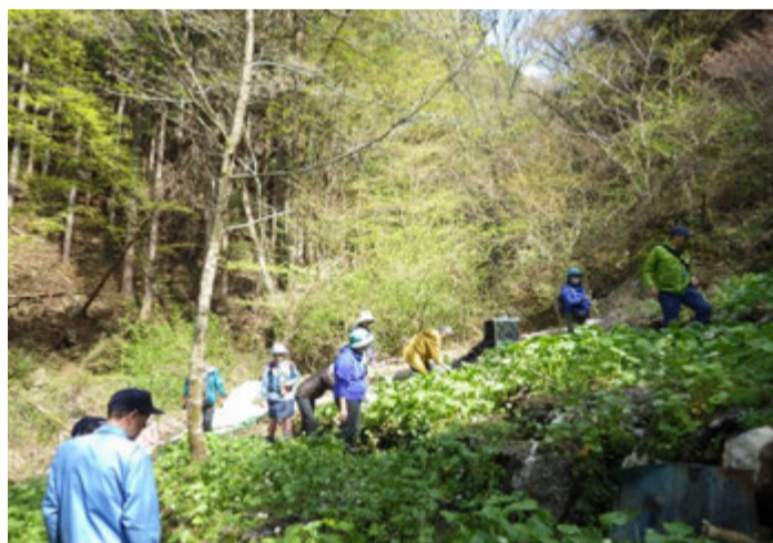
午後はワサビの花を取りに行って