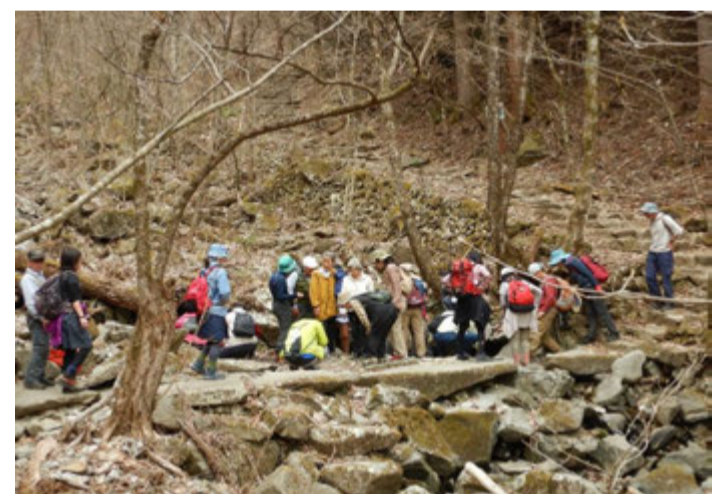
沢辺でサンショウウオを発見