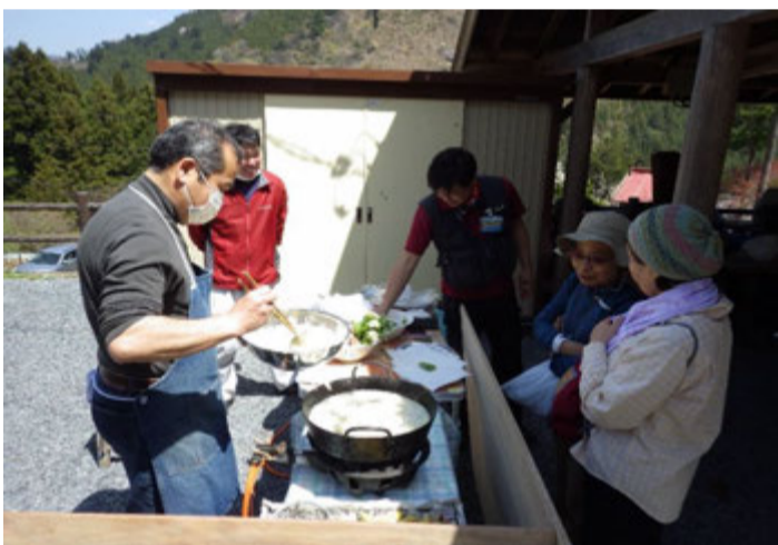
食べれる野草を天ぷらにいただきました