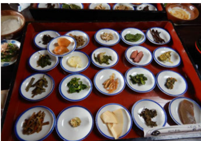
『三頭山荘』の山菜22品膳