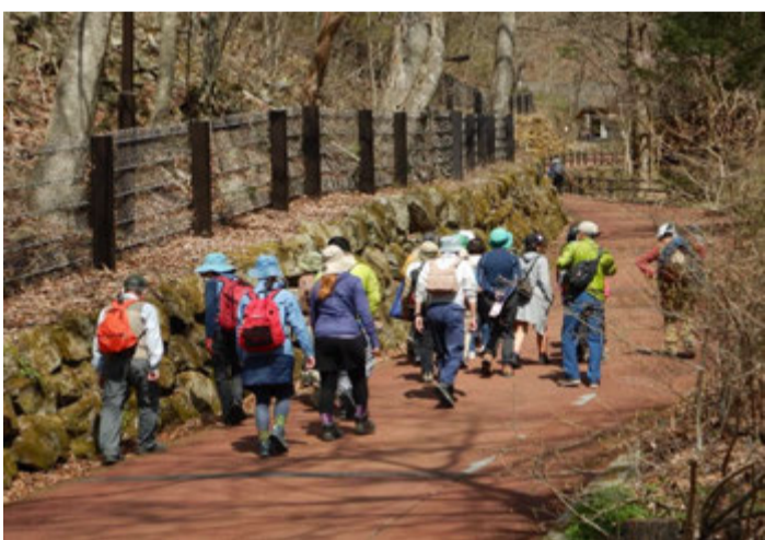
『檜原都民の森』の散策に出発