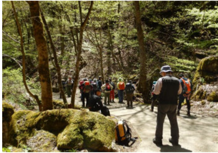
途中自然散策をしながら