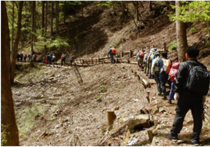
御前山を目指して登山道を行く