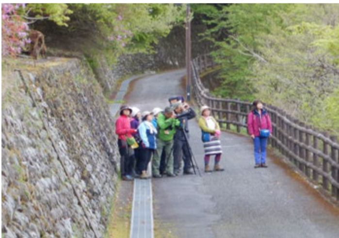
早朝に山のふるさと村園内を散策