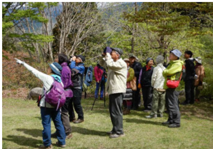
朝食後にバードウォッチング