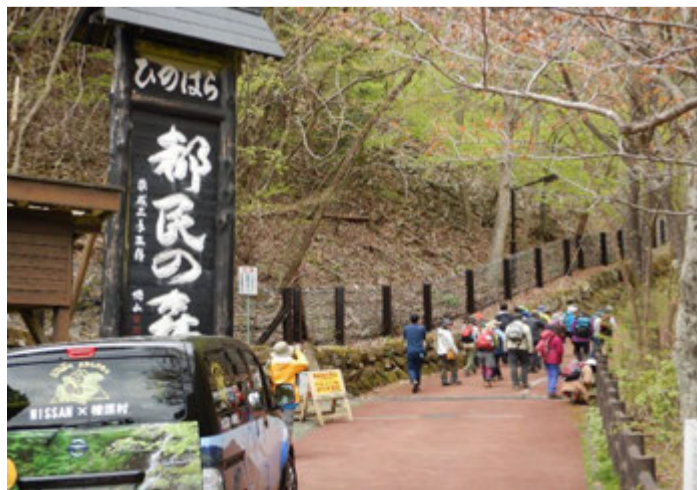
檜原都民の森入口を出発