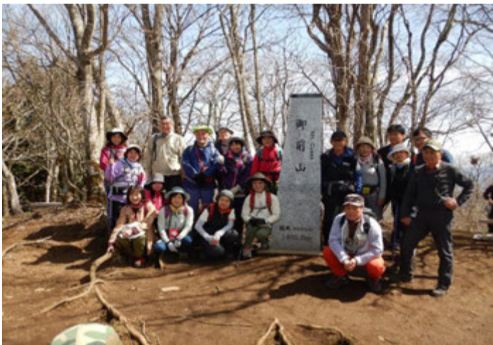
御前山山頂で記念撮影