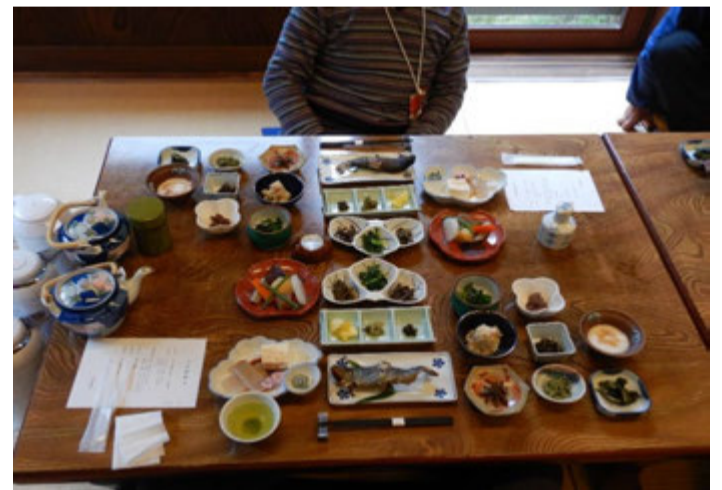
昼食は兜屋旅館の山菜料理