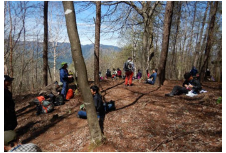
見晴らしの良い場所で昼食