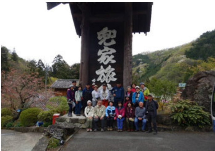
昼食後に記念撮影