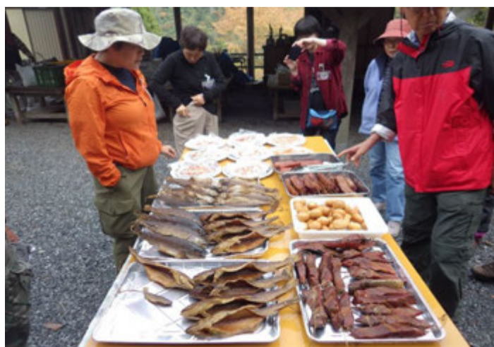
お土産がたくさん！！