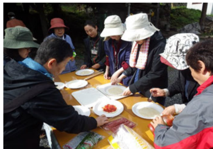
空いた時間にピザ作り