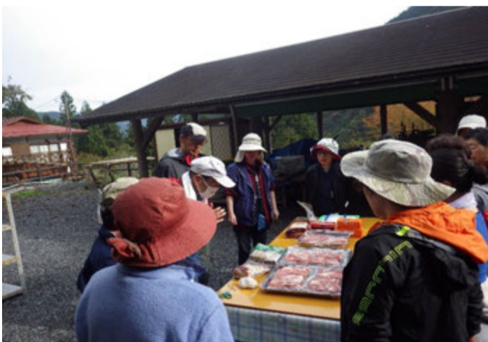
今日もよろしくお願いします