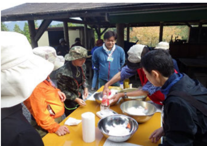
まずはピザ生地作り