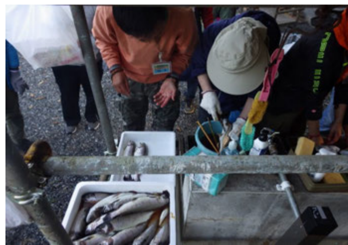
奥多摩やまめの仕込み作業や