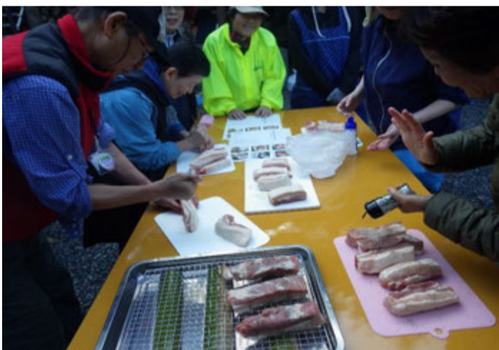
豚肉の仕込み作業等やって