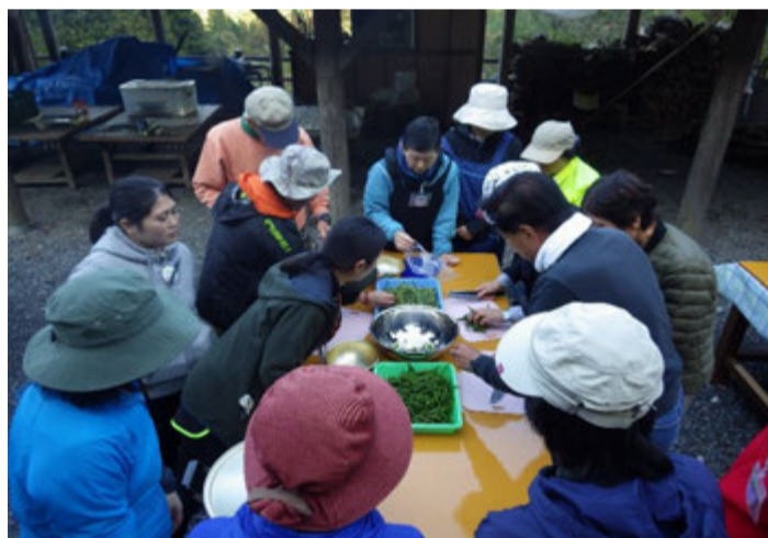
青唐辛子味噌も作りました