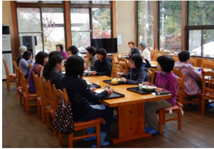
今日の昼食は食堂で