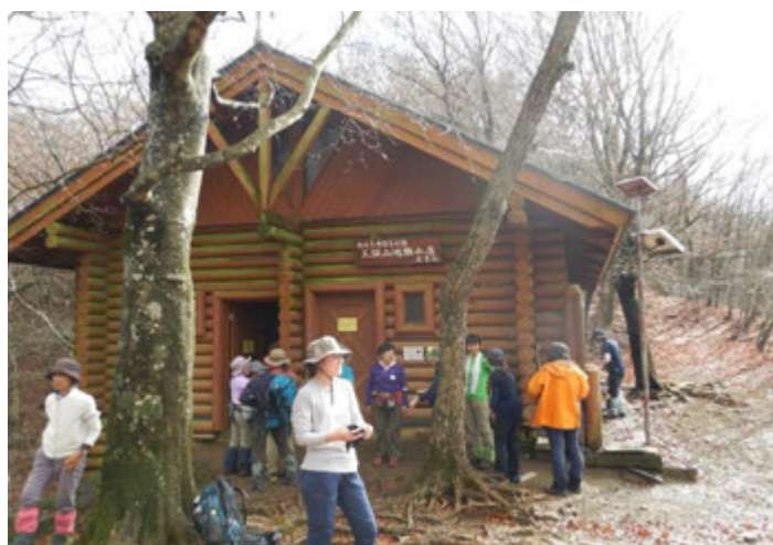
避難小屋でトイレ休憩