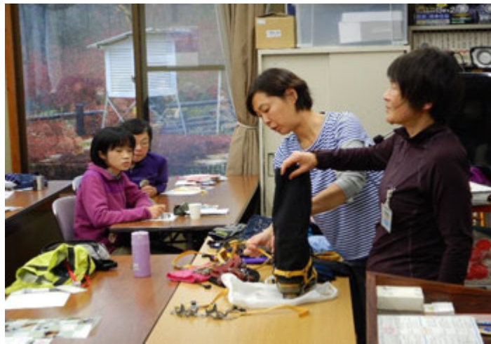
アイゼンの装着方法について