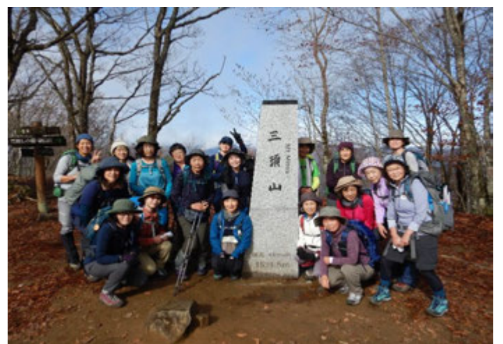
三頭山山頂で記念撮影