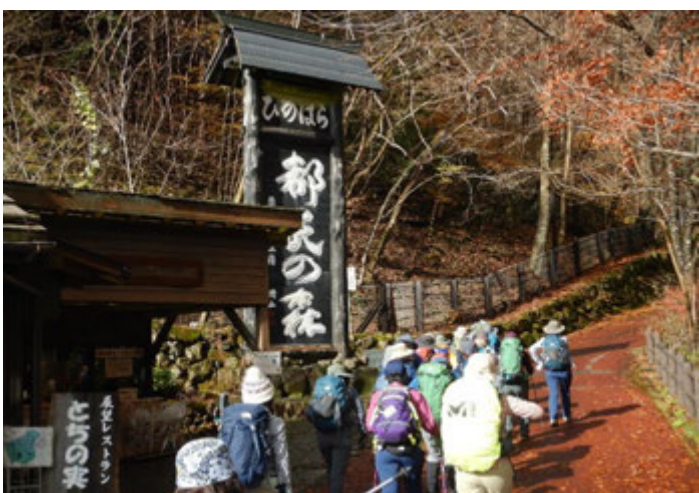
檜原都民の森駐車場から入山