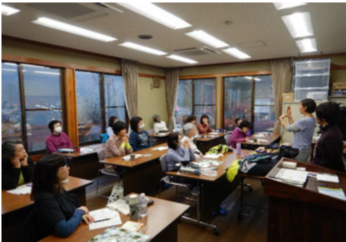
冬の山歩きに必要な装備について