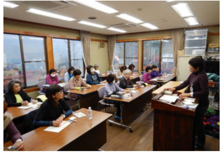
午後は研修室で講習会