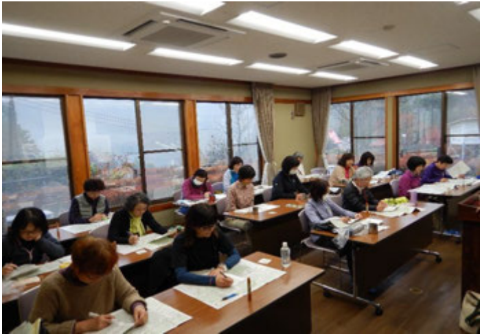
午前は研修室でガイダンス