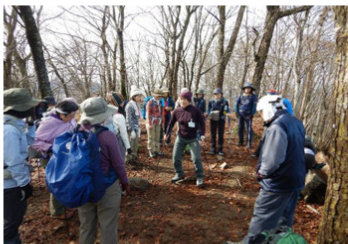
下山時の歩行方法についての講義