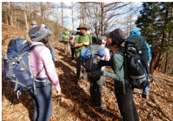
急登が終わったトオノクボで休憩