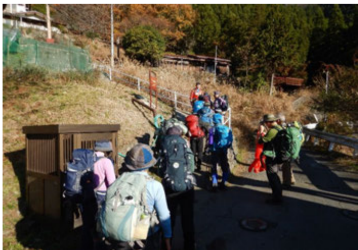
水根登山口から入山し