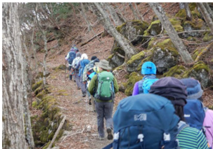
石尾根縦走路のルートで