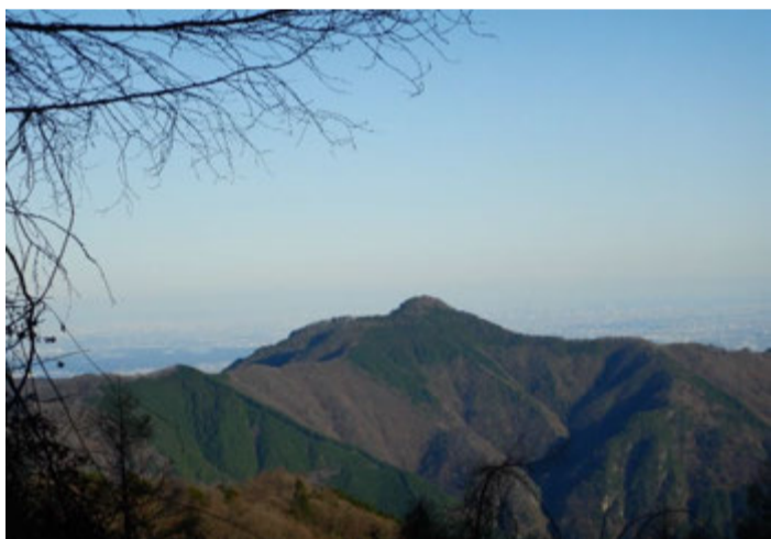
避難小屋前から大岳山を望む