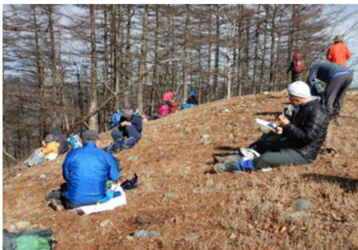
冷たい風が吹く中でお弁当を食べました