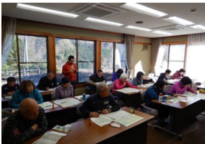
午前は研修室でガイダンス