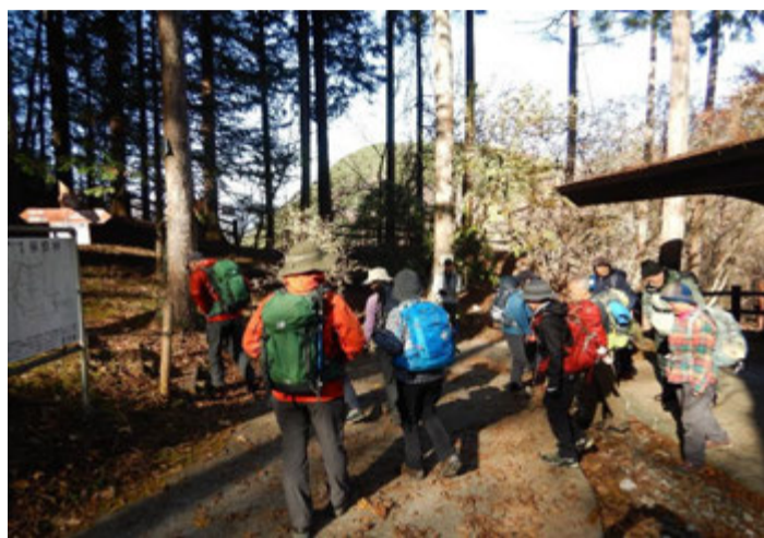
午後はトチノキ広場から入山