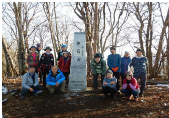
御前山山頂で記念撮影