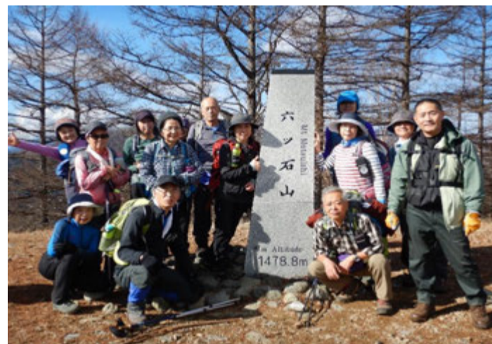
六ツ石山山頂で記念撮影