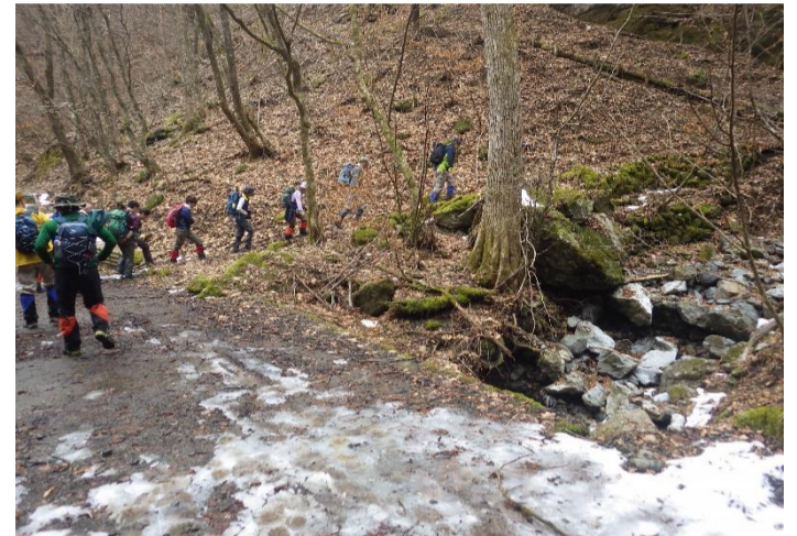
無事に下山、お疲れ様でした