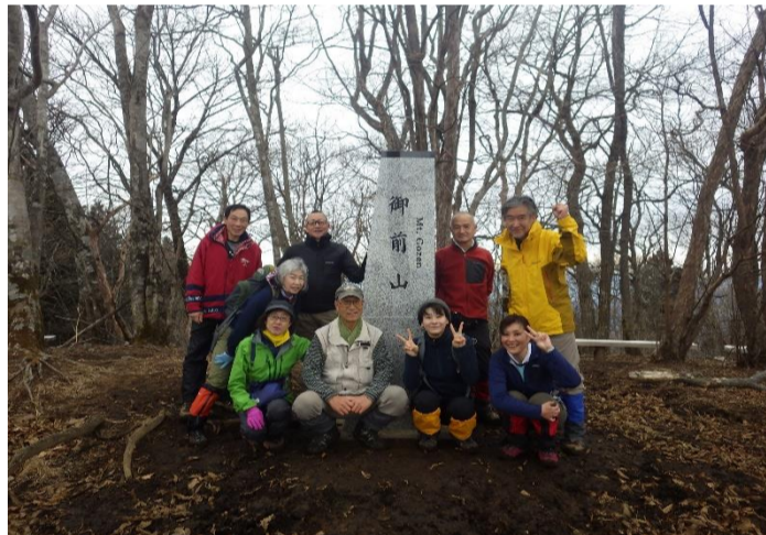
気をつけながら無事に山頂へ