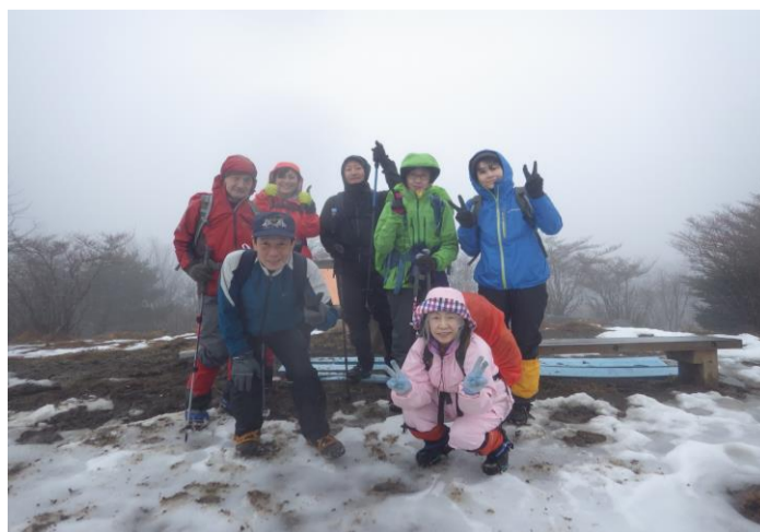
ハンゼノ頭で記念撮影