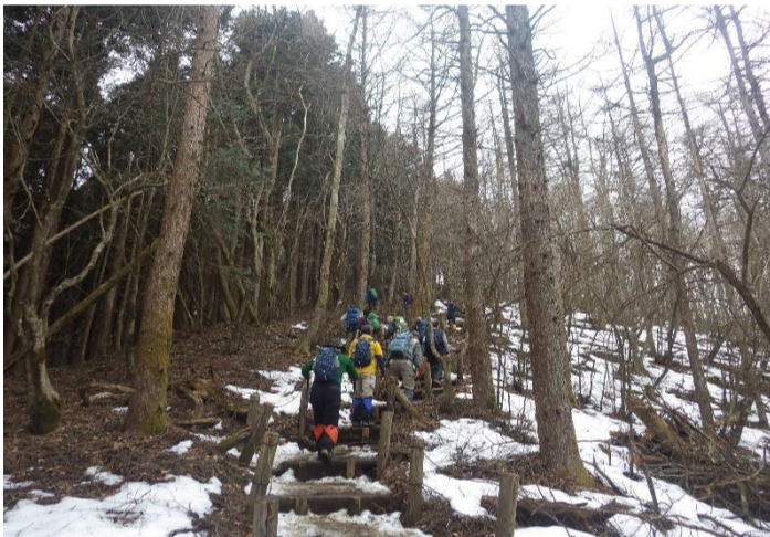
かなり滑りやすい...