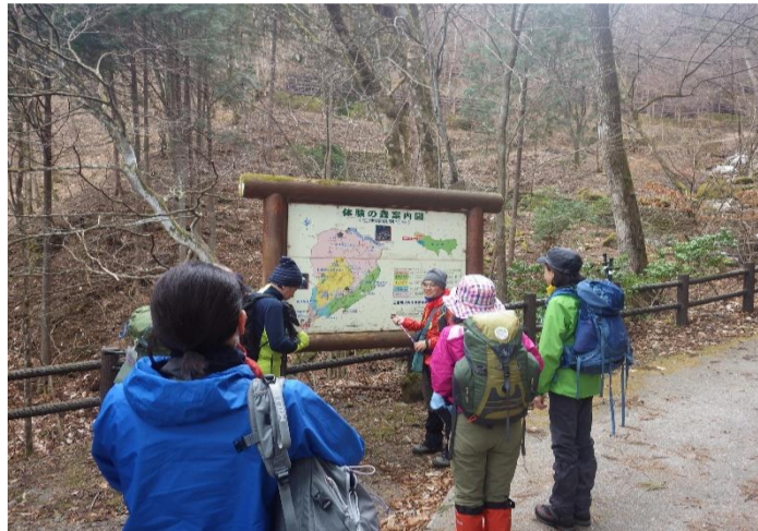
気をつけながら無事に山頂へ