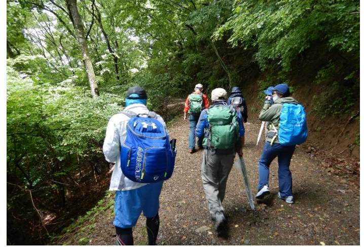
いこいの路を散策しながら歩き