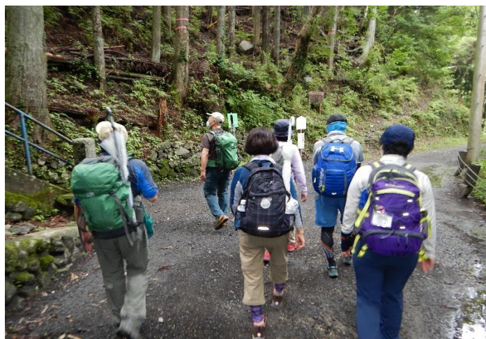
白髭神社の下を通過して