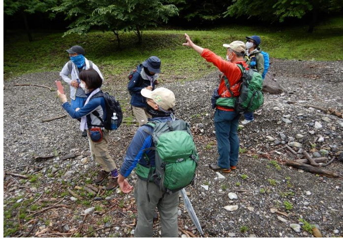
湖畔に下りて周囲を散策