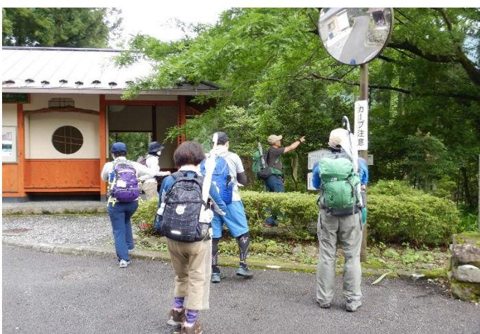
珍しい槐木を見学