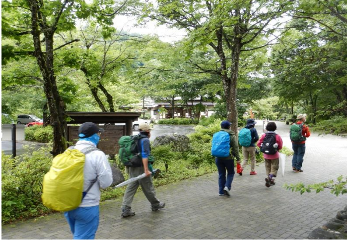
クラフトセンター前を出発