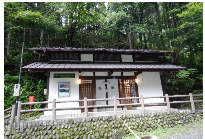
小中沢でトイレ休憩