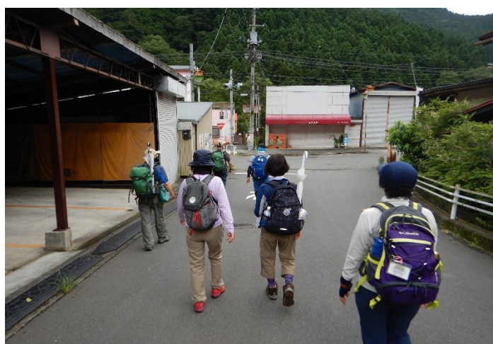
奥多摩むかし道の始点を通過して