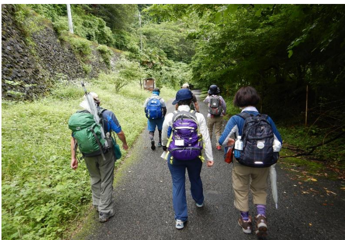
ダム下の西久保を出発