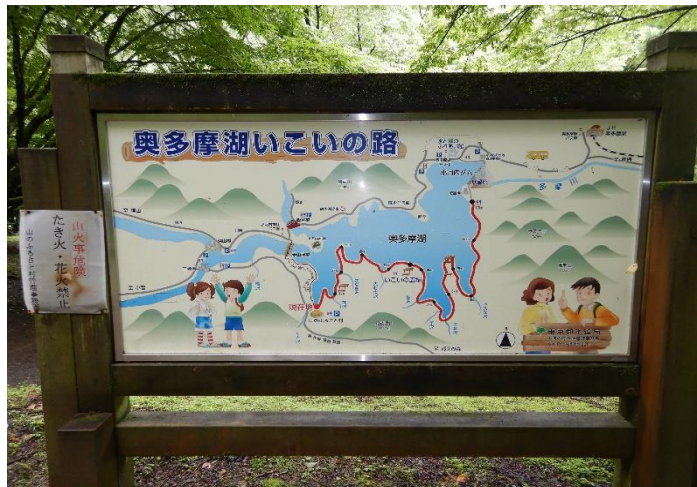
山のふるさと村に戻り