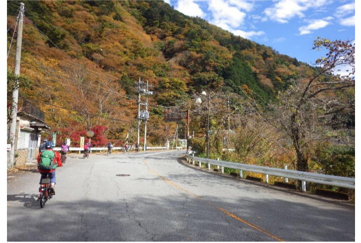
軽快に走りました