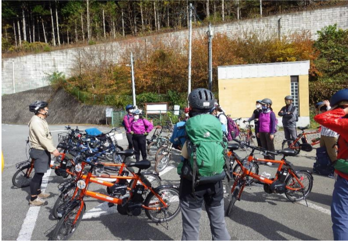
道の駅たばやまをスタート