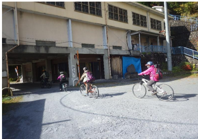
旧日原小学校からサイクリングスタート