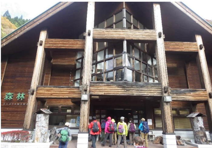
最初に日原森林館を見学