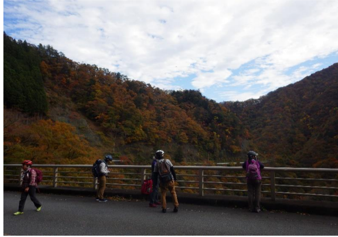
途中途中で紅葉を楽しみながら