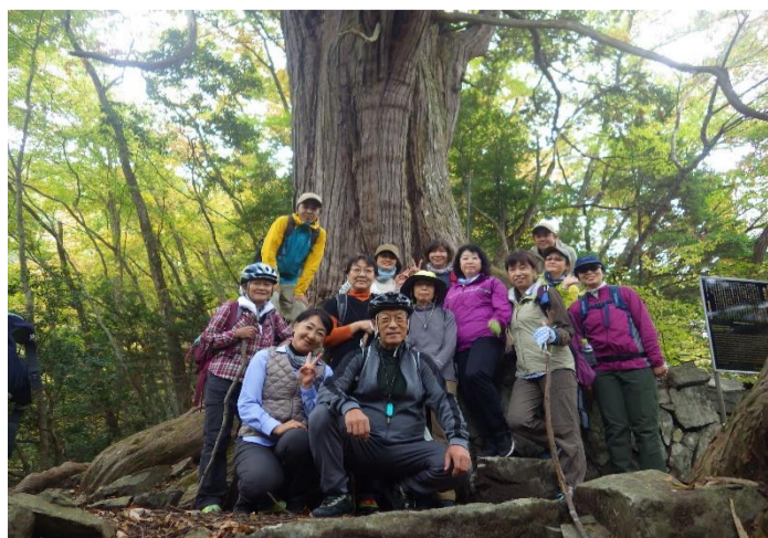
倉沢のヒノキにて記念撮影