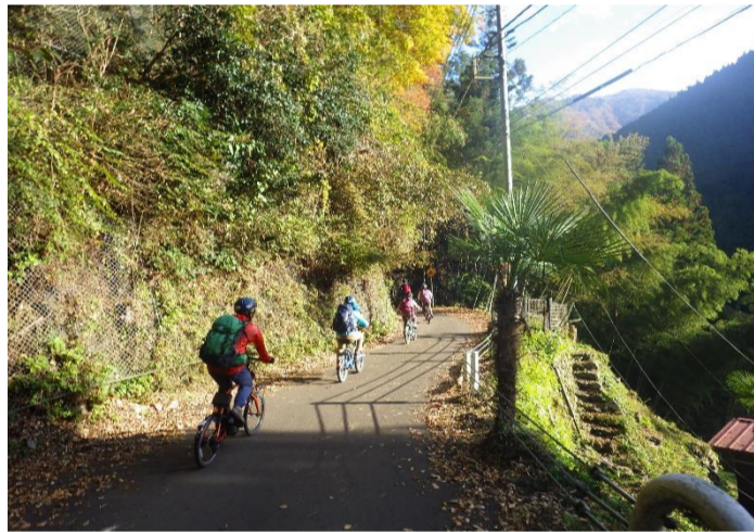
奥多摩むかし道を通して