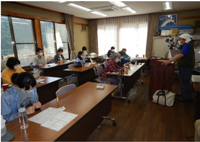
地図読みの講習会