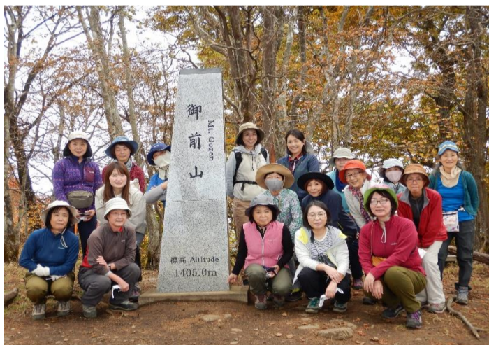
御前山山頂に到着して記念撮影