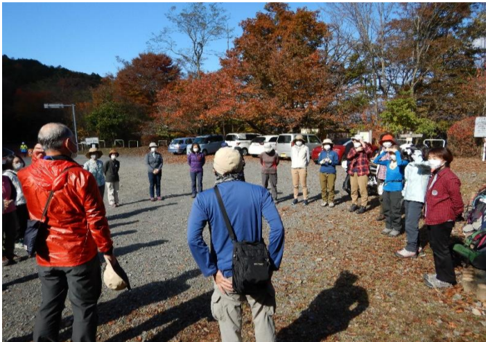
青空の下でガイダンス等を行い