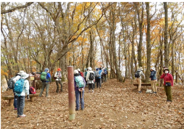
午後も2班に分かれて出発