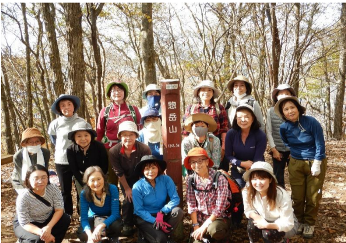
惣岳山山頂で記念撮影