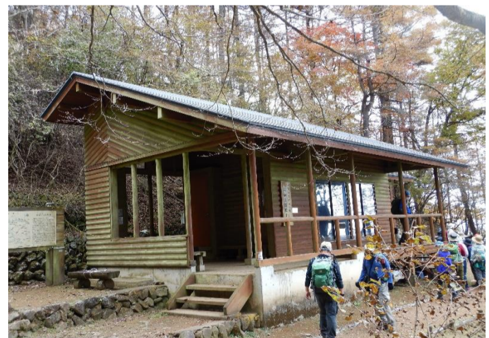
御前山避難小屋でトイレ休憩