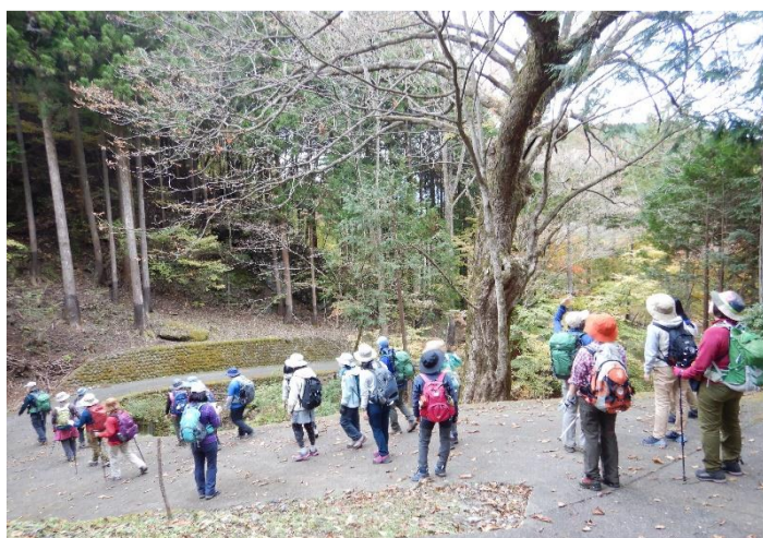
トチノキの巨樹を見学