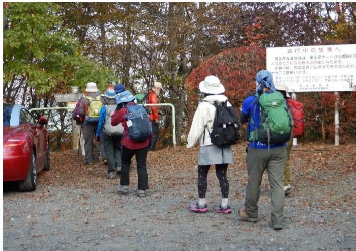
登山口をまず1班が出発