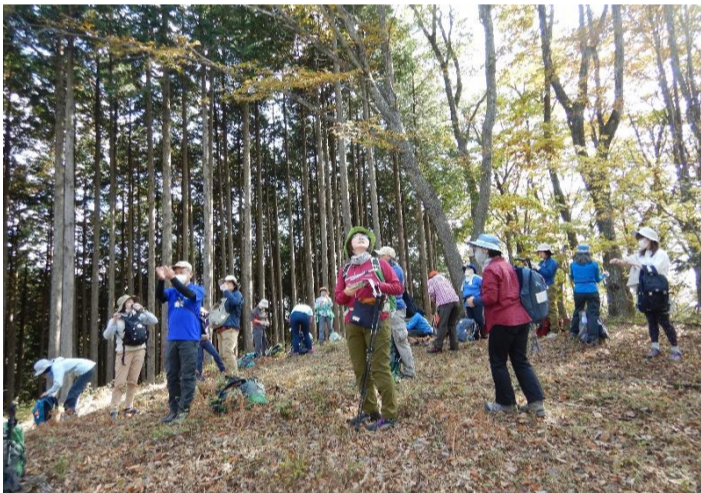
小河内峠手前の水窪山で休憩