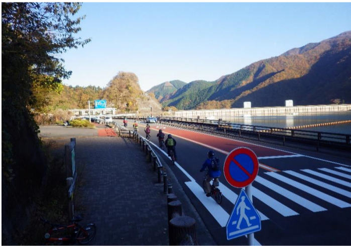
奥多摩湖畔沿いから