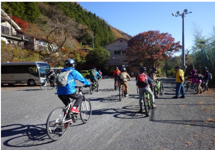
まずは自転車の乗り方から