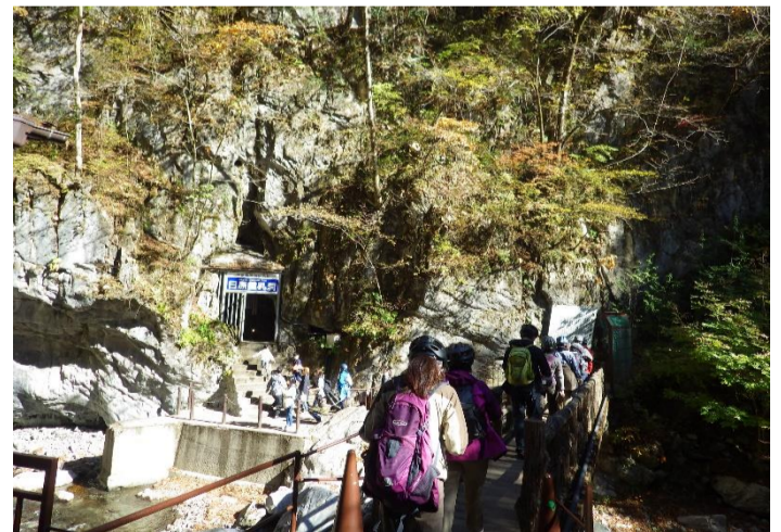
日原鍾乳洞を見学後