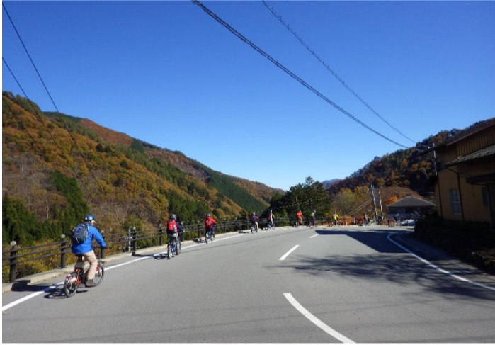
道の駅こすげをスタート