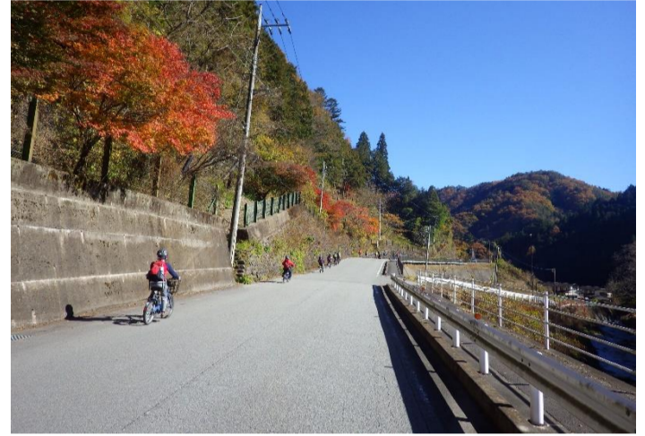
快晴のサイクリング日和