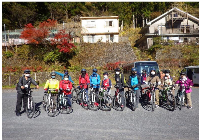
今日も頑張りましょう！！