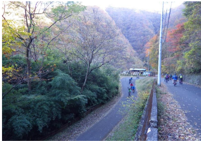
奥多摩むかし道へ