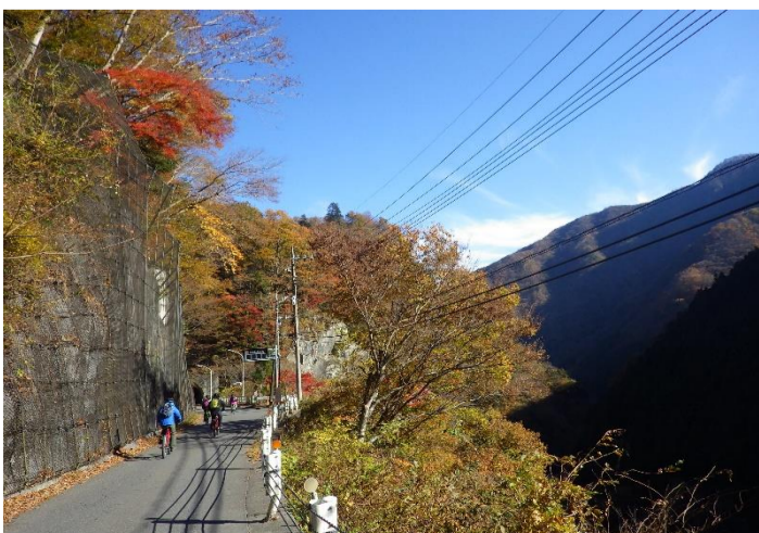
本格的にサイクリングスタート