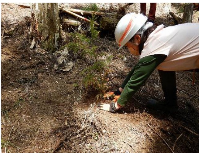
すくすくと成長しますように！！