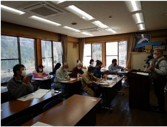
獣害防止柵設置手順説明