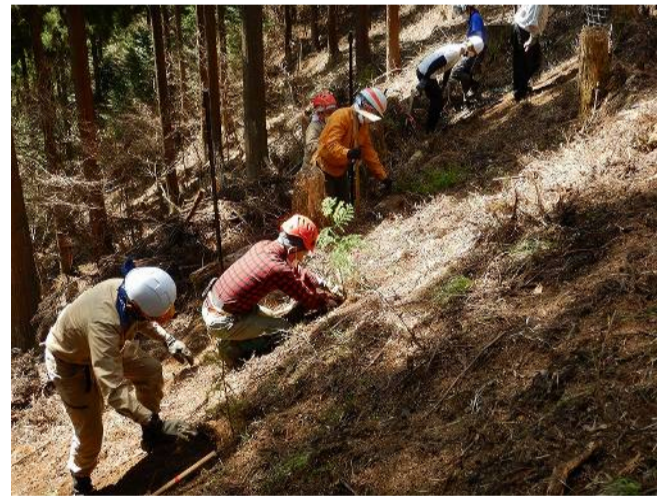
無事終了しました。お疲れ様でした。