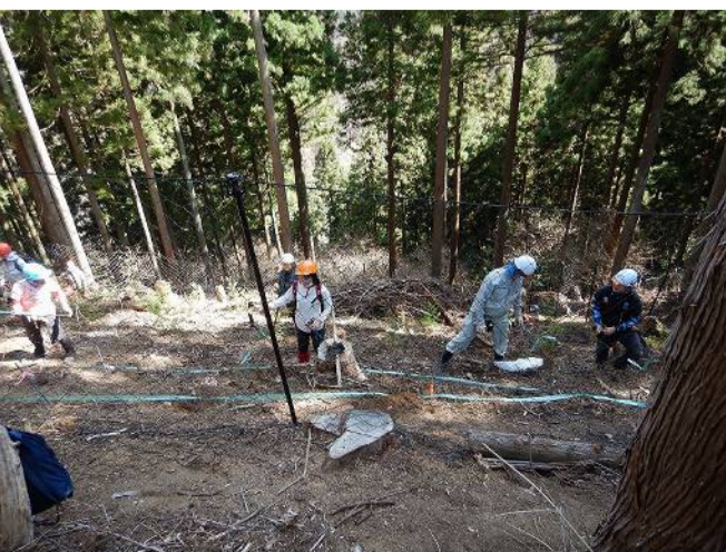
間隔を空けて植えていきます。