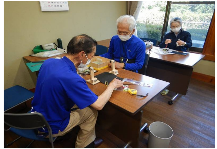
教わりながら仕掛け作りをします