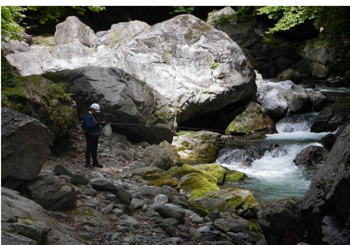
ゆっくり、じっくり