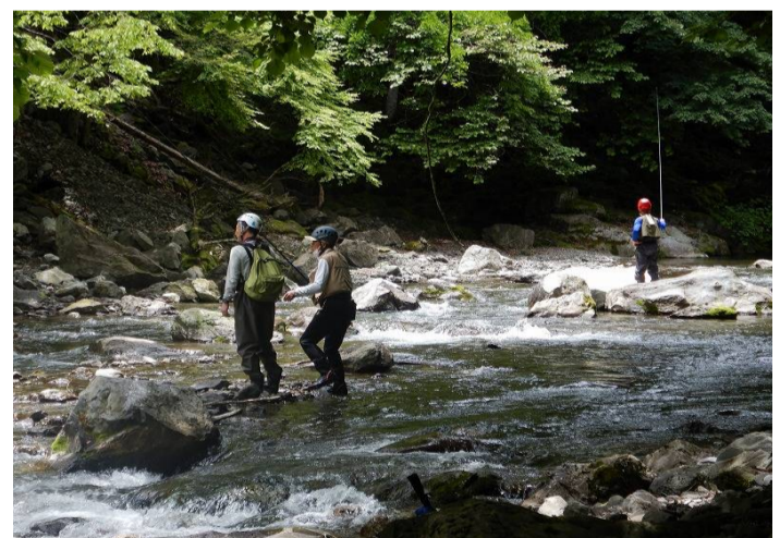
釣りのポイントなど色々教わりながら