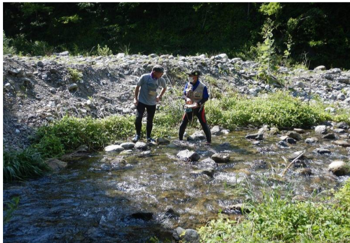
エサ取りを教わります