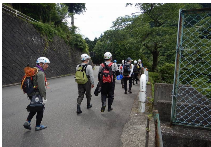
日原川に向けて出発です