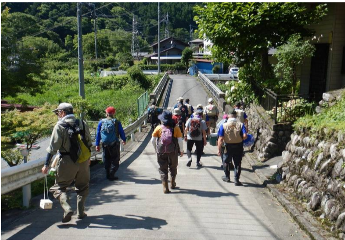
明日のエサとなる川虫取りへ出発