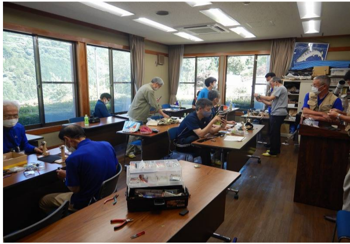
仕掛け作りの様子