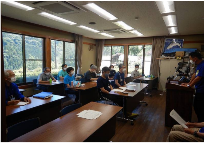
ガイドンスの様子