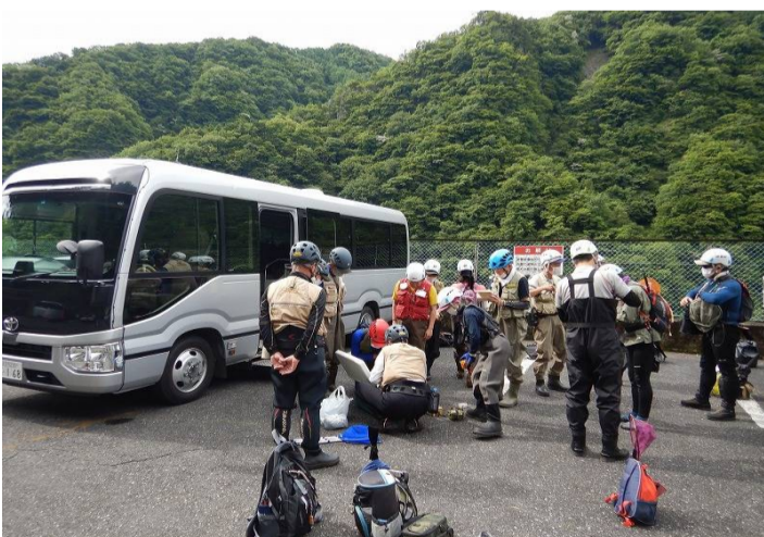
日原川に向けて準備します