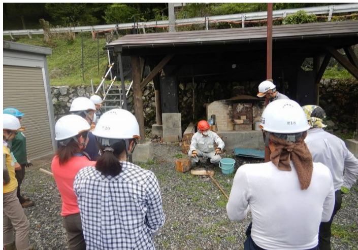
刃研ぎの講習を受けます