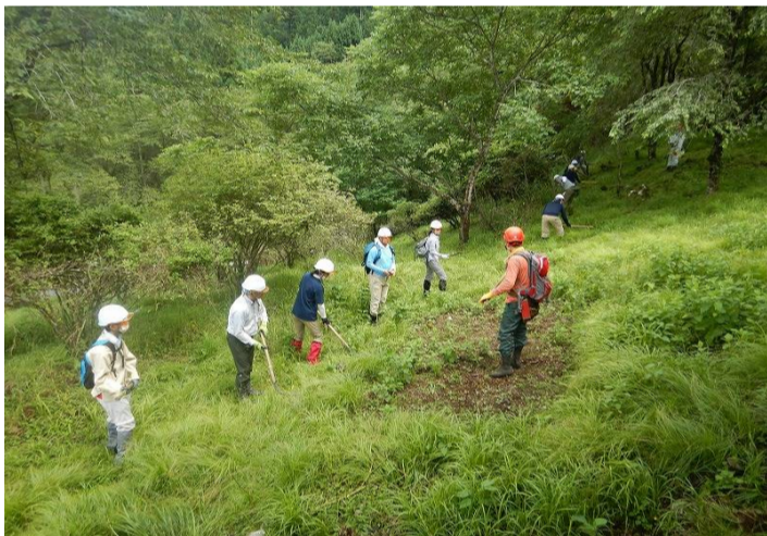
列になり下刈りをしました