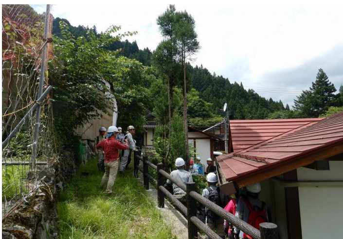
大杉の伐採をしました