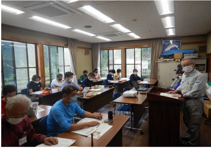
午前中は室内講義