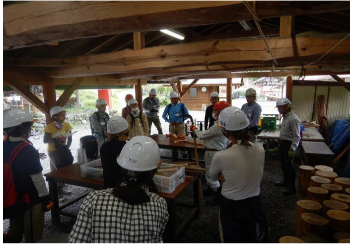
鎌の使い方を教わります