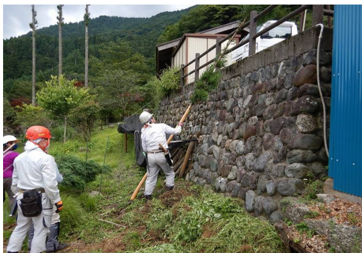
皮を剥ぎ乾燥させます