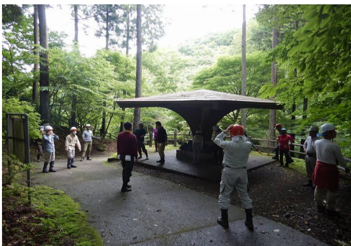
道具を背負って登山道を登ります。