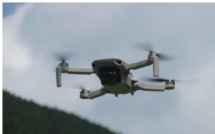
このドローンから