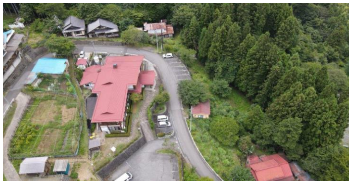
ドローンからの空撮写真③