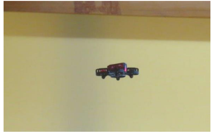
すぐにミニドローンの操作感覚をつかみました