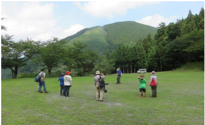
午後は外に出て大きなドローン进行操作