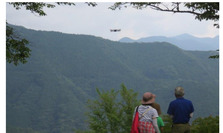
ミニドローンでの操作を活かしながら