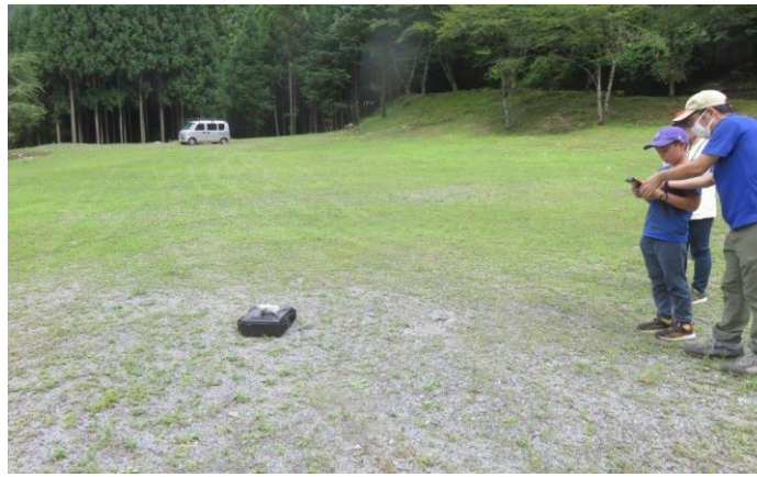
先生に教わりながら飛ばしてみます