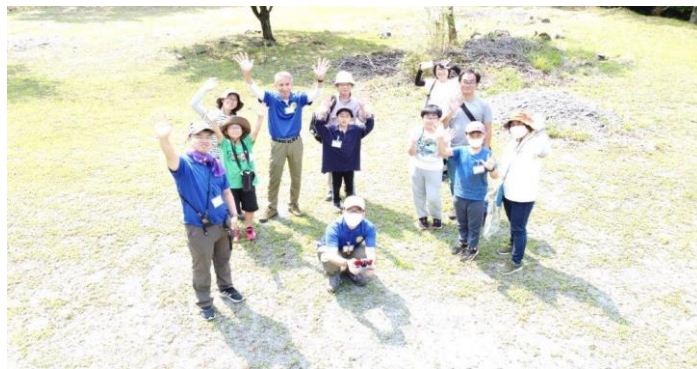
このような集合写真が撮れました