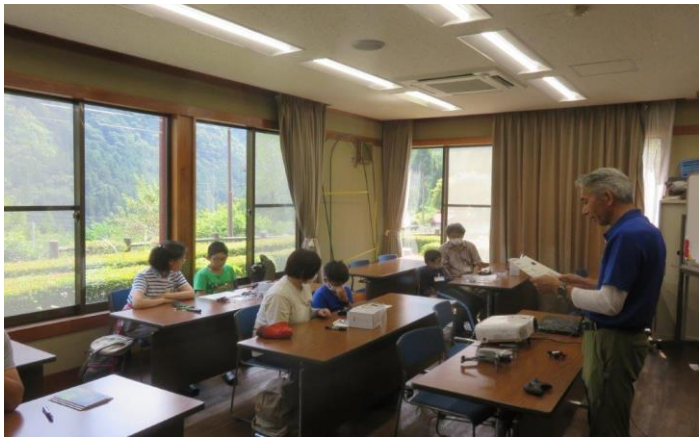
ガイダンスでドローンの特性を学びます