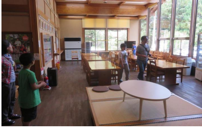
室内でミニドローンの練習