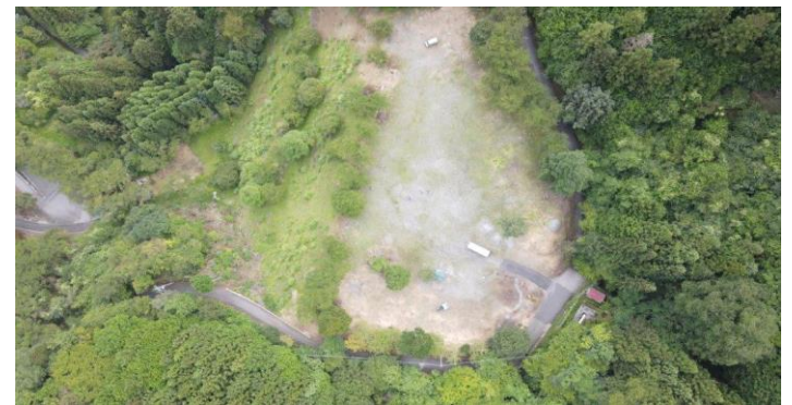
ドローンからの空撮写真①