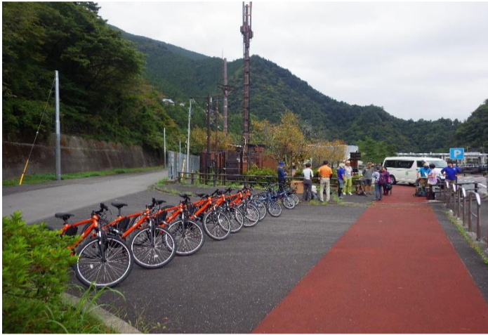
水と緑のふれあい館前から