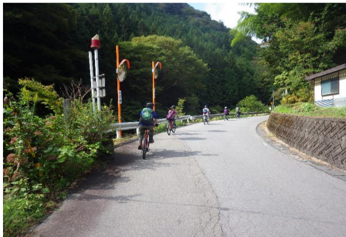
今日も電動アシスト自転車です