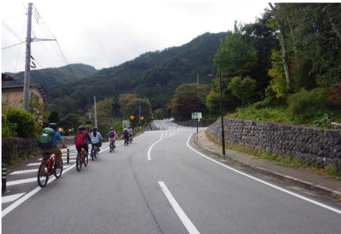
道の駅こすげに立ち寄り