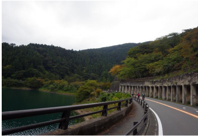
電動アシスト自転車スタート