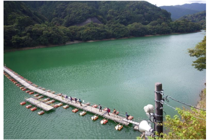
途中、麦山浮橋を見学