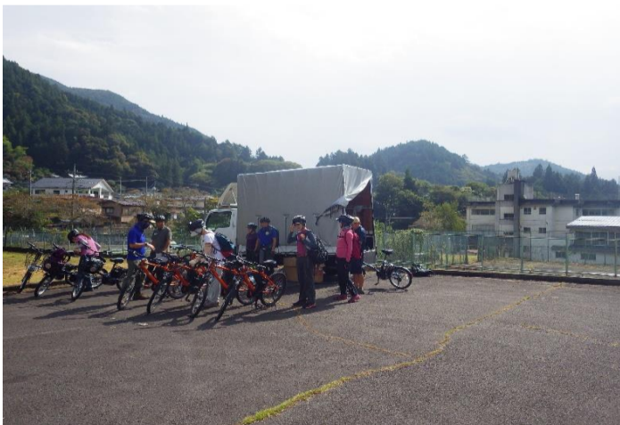
びりゅう館(山梨県上野原市)からスタート