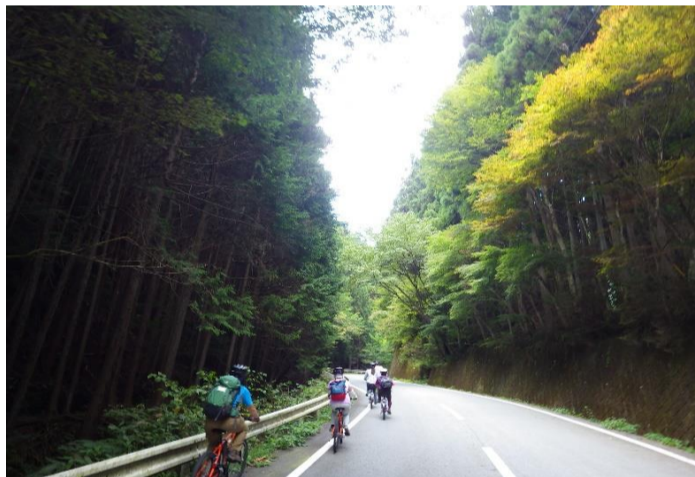
今川峠を越えて丹波山村へ