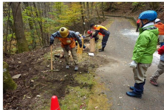
設置場所の穴掘り作業、大変でした。