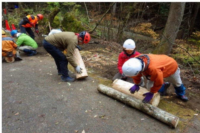
座面に足を取付けて完成です