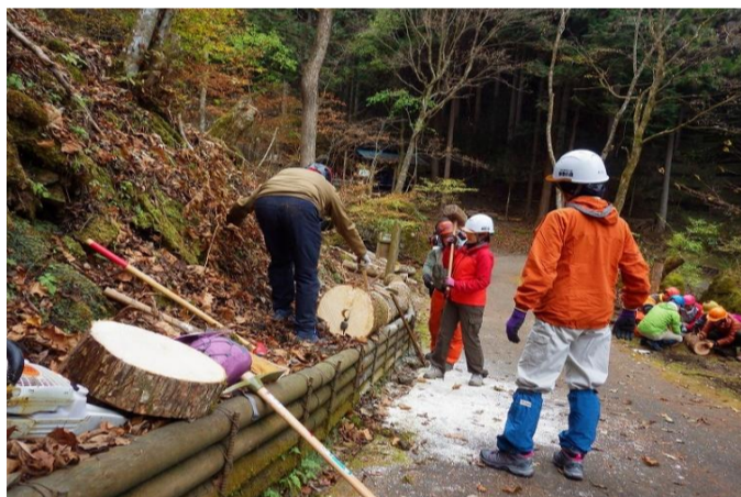
サワグルミを使う班に分かれて作業