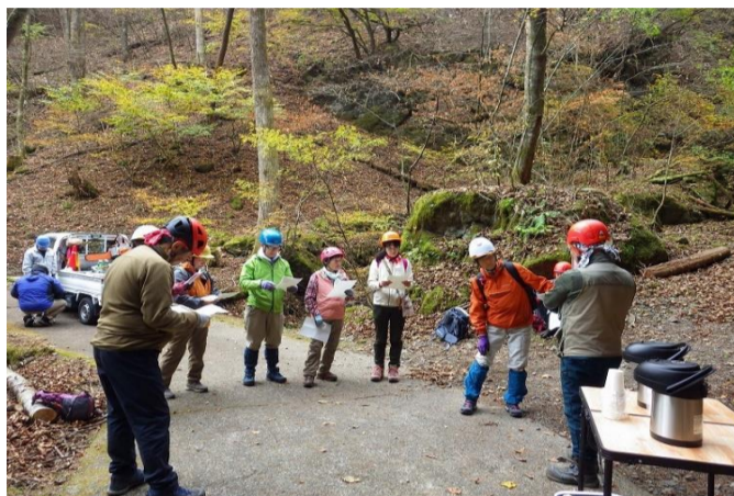
まずは作業の説明