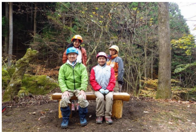
スギを使った班の完成写真