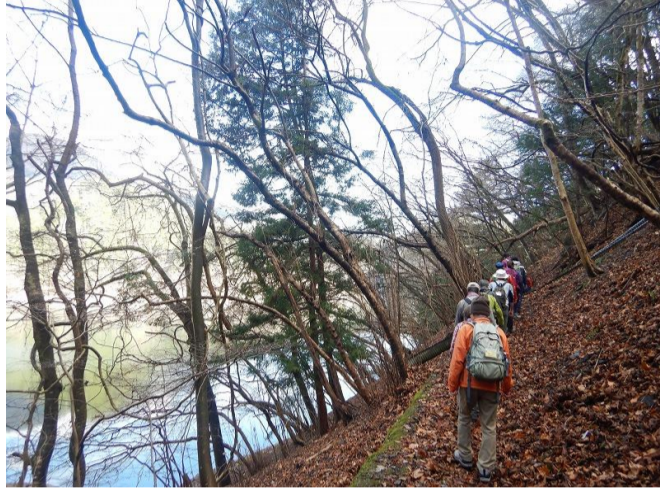
山のふるさと村に到着 広場でお昼ご飯を食べます