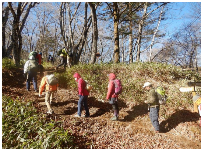
ハンゼノ頭で記念撮影