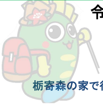
栃寄森の家で行程の確認