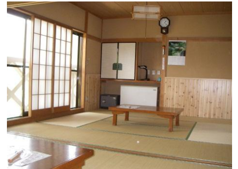
客室(和室)は全5室(8・8・8・10・18畳)です。

お風呂は大小2か所をご利用人数に応じてご用意いたします。シャンプー・ボディシャンプーは常備していますが、タオル・歯ブラシ等をご持参ください。