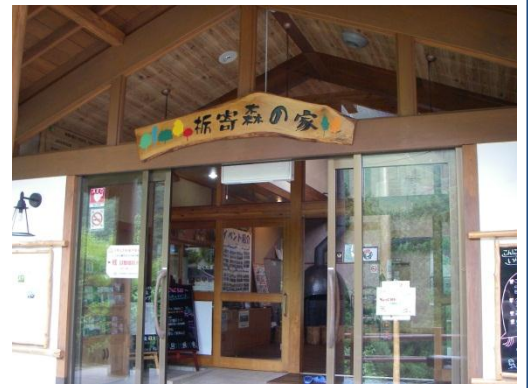
玄関のインフォメーションコーナーでは町内外施設のパンフレットを取り揃えています。