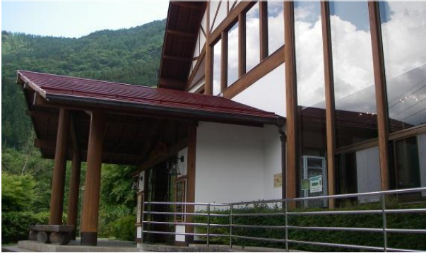
正面はガラス張りで周囲の山々が望めます。